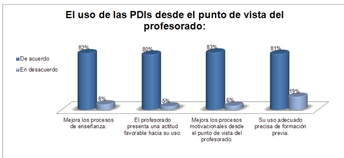
Gráfica 2: El uso de las PDIs desde el punto de vista del profesorado.

Por último, atendemos a una valoración de la necesidad de formación para el docente en conocimiento y utilización de la Pizarra Digital Interactiva, y obtenemos que casi la totalidad de las respuestas, nos indican que se considera preciso obtener formación para enseñar con la PDI (91,17%), para facilitar una utilización eficaz (97,06%)