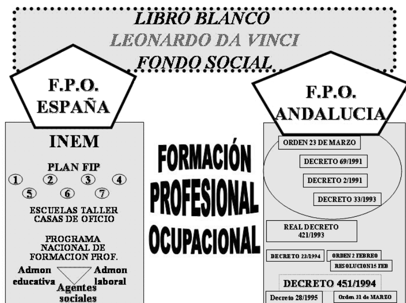
Gráfico 3. La Formación Profesional ocupacional.

La política actual en materia de Formación Profesional encuentra un nuevo rumbo a partir del Tratado de la Unión firmado en Maastrich en 1992. En relación a esta nueva etapa son tres los elementos sobre los que queremos llamar la atención como ejes de la misma: