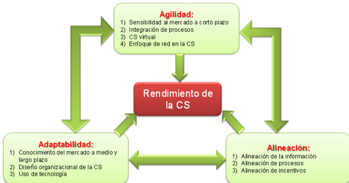
Figura 2. Relaciones de la triple A con el desempeño de la CS

Los resultados permitirían, entre otros, observar los pesos relativos de estas variables en cuanto a su incidencia en el rendimiento de la CS, así como determinar si es necesario que se den las tres para obtener los mayores rendimientos y para que éstos se mantengan a largo plazo. Para el estudio de la sostenibilidad será necesario el desarrollo de estudios longitudinales que permitan conocer el efecto que tienen estas variables a lo largo del tiempo.