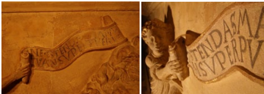
Figura 3 Ángel con filacteria de las palabras pronunciadas por Dios ante el ofrenda de Abraham durante el sacrificio de Isaac su hijo (Gen. 22, 12). Roque de Balduque. Antes y después de la última restauración.