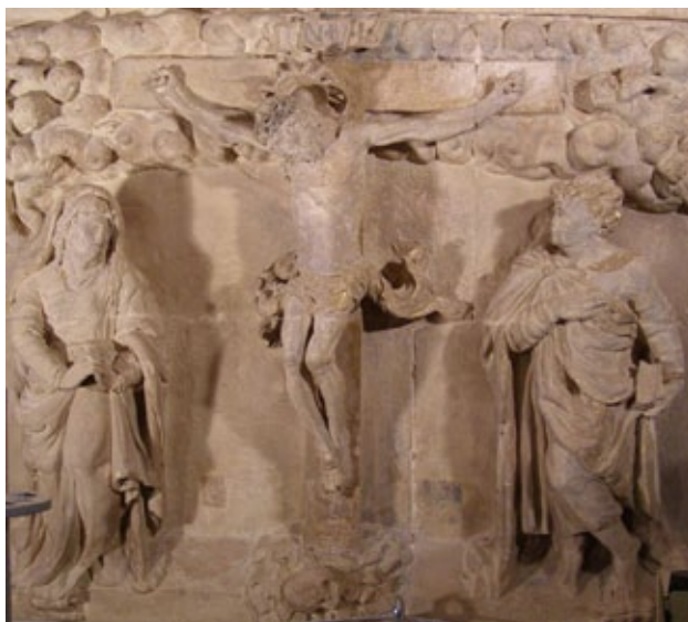
Fig. 1 Calvario, Roque de Balduque, c. 1534, frente sur o muro de la presidencia del Cabido Bajo. Casas Consistoriales de Sevilla.