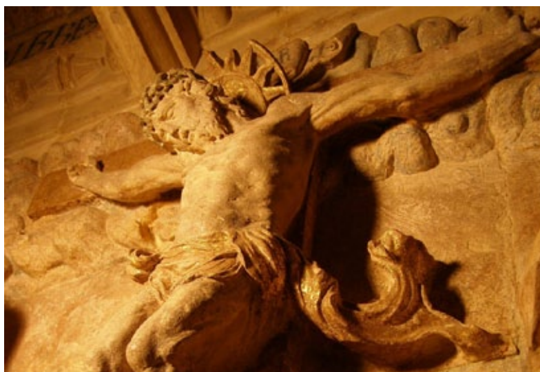
Fig. 5 Crucificado del Cabildo de las Casas Capitulares de Sevilla. R. de Balduque. Bellísima escultura de gran sentido de la nobleza y magnificencia renacentista, incluyendo las novedades italianas, suavizada por la sensibilidad holandesa del escultor. En el paño de sudario o perizona se contienen novedades compositivas con sinuoso movimiento de acento manierista.