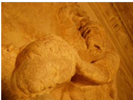
Figura 2. Abraham ofreciendo el sacrificio de Isaac. Roque de Balduque. Sala Capitular. Muro sur de la Presidencia. Bella composición, con significativos vuelos y pliegues de las telas.