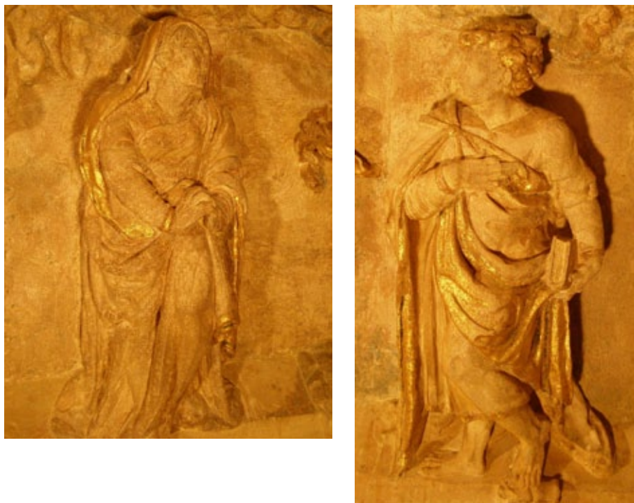
Fig. 6. San María y San Juan, R. de Balduque, Calvario del Cabildo de las Casas Capitulares de Sevilla.