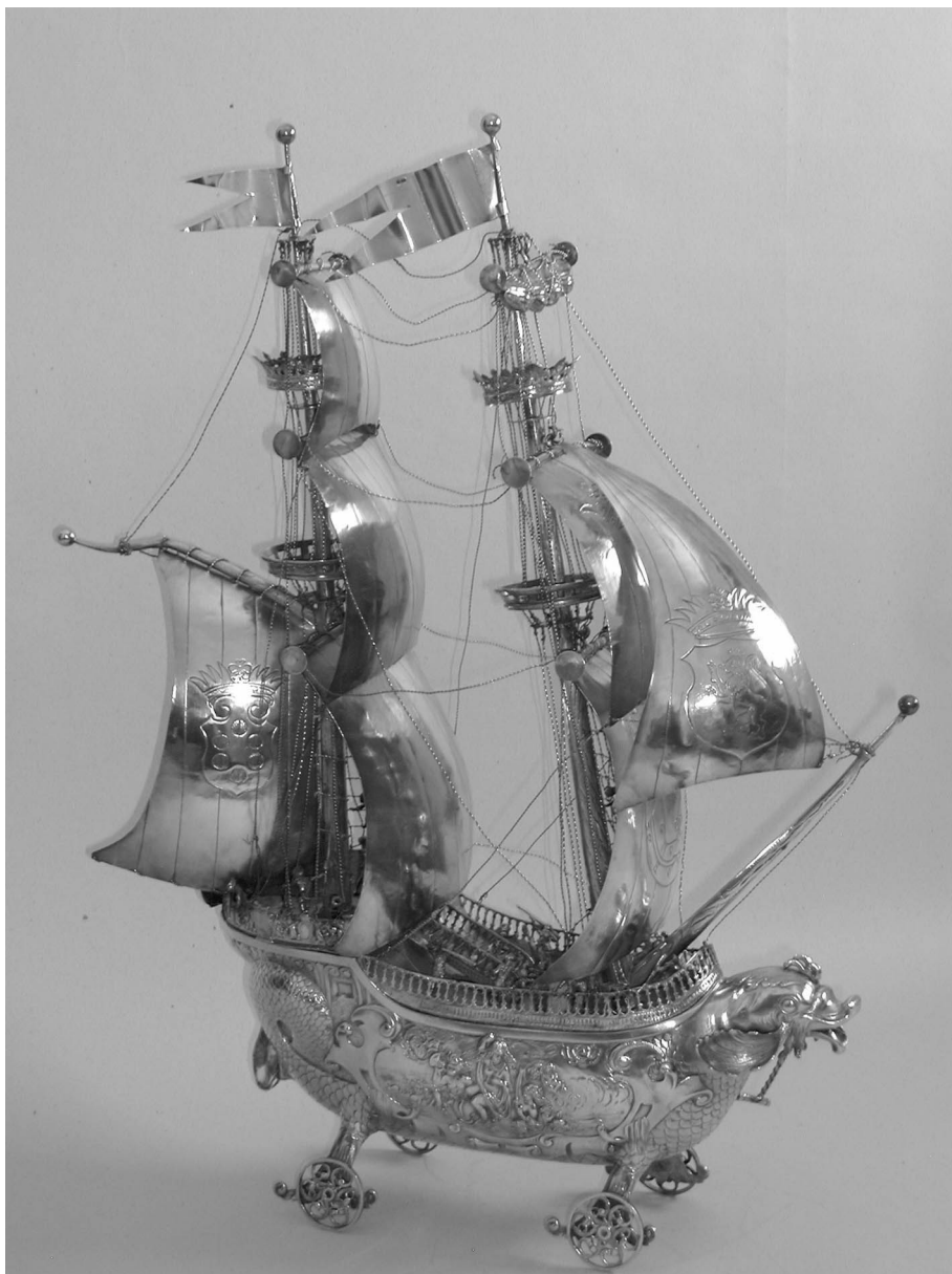
1. Vista del navío desde estribor