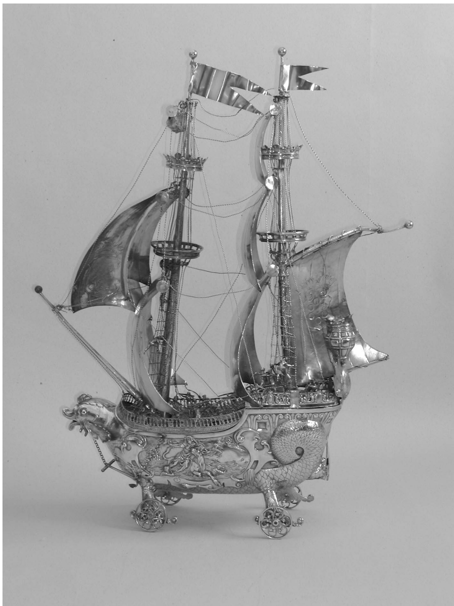
2. Vista del navío desde babor