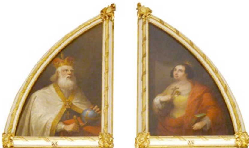
Figura 5. Antonio Cabral Bejarano. San Carlomagno y Santa Amelia.