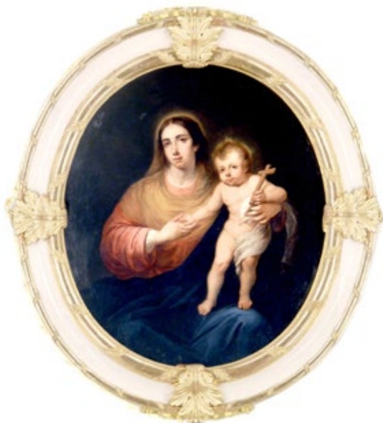
Figura 2. Antonio Cabral Bejarano. Virgen con el Niño.