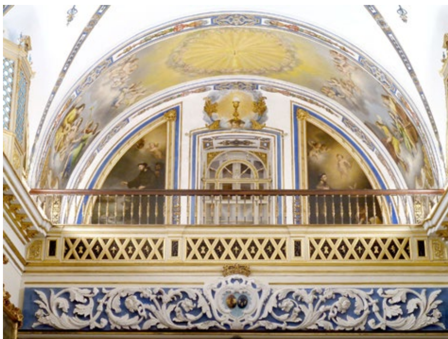
Figura 6. Capilla del Palacio de San Telmo. Vista de la tribuna y bóveda de coro.