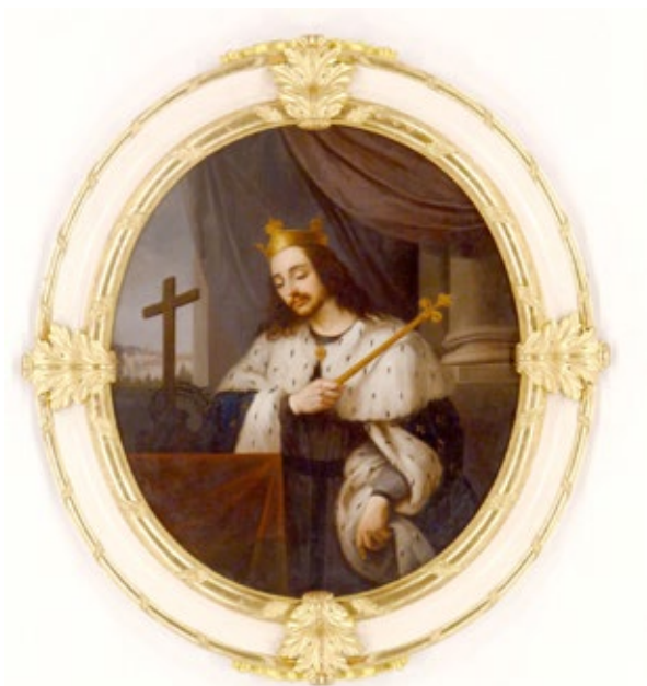
Figura 3. Antonio Cabral Bejarano. San Luis.