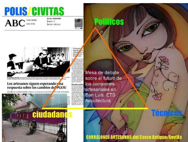
Figura 15: Construcción del triángulo de la Gestión Social del Hábitat y de la Universidad transformadora para apoyar el derecho a permanecer en el centro de los artesanos. Elaboración propia. Fotografías del autor.

Una polis está emergiendo allí donde el mercado está produciendo un cambio en la civitas, desalojando a los vecinos originarios y sustituyéndolos por profesionales, estudiantes que comparten pisos, personas solas o en pareja que ocupan los minúsculos apartamentos que son la oferta dominante. Y estas situaciones de conflicto son propicias para la colaboración entre universidad y movimientos sociales y para que la universidad medie, construyendo un triángulo, con las administraciones públicas responsables. La respuesta de las administraciones local y autonómica al problema de pérdida de población original, y por tanto, de identidad, del barrio, ha venido a través de la declaración de un Área de Rehabilitación Integral que permite diseñar un programa de actuación en el que, mediante acuerdos con los propietarios de inmuebles y ayudas públicas, se está llegando a rehabilitar casas de vecinos con el compromiso de mantener los contratos de alquiler. Es una iniciativa de interés pero que ha tenido escaso éxito por haberse emprendido tarde y en plena burbuja inmobiliaria. Muchos propietarios han encontrado tentadoras ofertas de compra que han considerado más atractivas que el programa. Ante un mercado desahogado la capacidad reguladora de la administración se ha visto muy limitada.