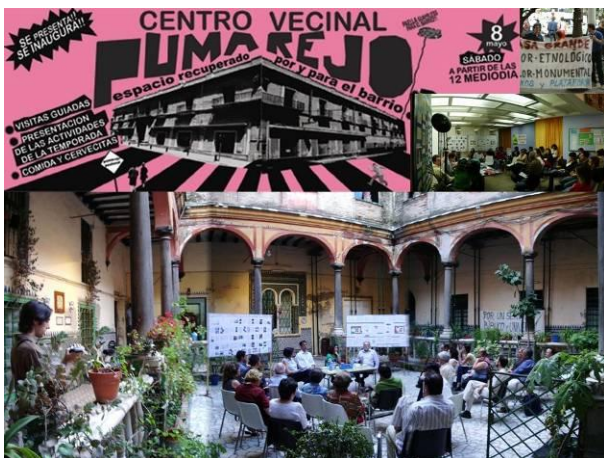
Figura 13: Activismo ciudadano en el Centro Social de la Casa del Pumarejo (Sevilla). Elaboración propia. Fotografías del autor.

chas ocasiones, por parte de la administración local, para declarar en ruina las casas de vecinos y proceder a desalojarlas, tal y como ocurrió en la calle Palacios Malaver, donde pude asistir asesorando técnicamente a los vecinos desalojados. Los vecinos acamparon a la puerta de su casa exigiendo soluciones pero perdieron sus derechos. Donde hay un problema la gente se organiza y reconstruye la POLIS. Este y otros casos hicieron surgir respuestas ciudadanas. Se creó la "Liga de Inquilinos La Corriente" para asesorar, con asistencia técnica, a los vecinos amenazados de desalojo. El barrio, que ya fuera reducto de la resistencia al levantamiento franquista, sigue siendo considerado el barrio rojo de la ciudad. Activistas jóvenes se han unido a los vecinos para salvar la Casa del Pumarejo y crear un centro social autogestionado desde el que presta sus servicios de asesoramiento la Liga La Corriente (Figura 13).