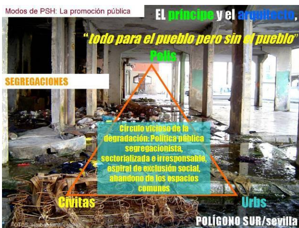
Figura 17: Círculo vicioso del hábitat social en Polígono Sur. Elaboración propia. Fotografía del autor.

El barrio tiene un fuerte porcentaje de población de etnia gitana, con formas de habitar propias, muy apegadas al suelo y a la cultura de la fogata. Ha sido duramente castigado por el paro y la droga en la década de los ochenta. Este deterioro social rápidamente se plasma en el aspecto físico del barrio, la URBS. Los espacios libres se convirtieron en espacios de nadie, inseguros e insalubres. Se produjo un proceso de chabolismo vertical. Empezó el círculo vicioso de la exclusión social (Figura 17).