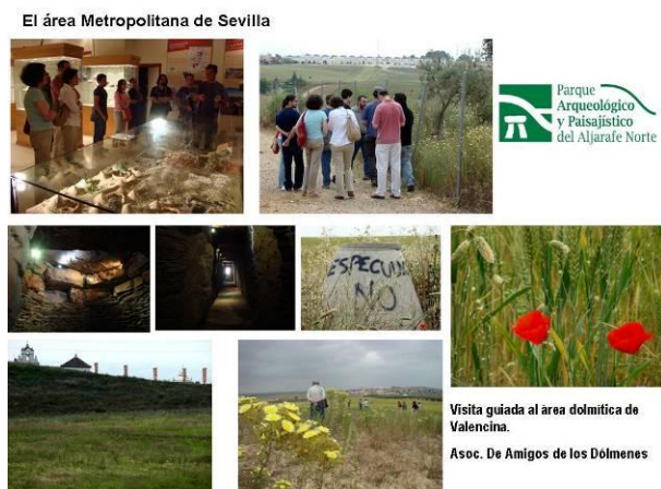
Figura 10: Visita guiada al territorio dolménico donde la iniciativa social promueve el Parque Arqueológico y paisajístico del Aljarafe (Sevilla). Elaboración propia. Fotografías del autor.

En este contexto parece difícil que surja una POLIS. Sin embargo, donde hay problemas de hábitat surgen grupos dispuestos a organizarse para afrontarlos. La plataforma Ah! ("Aljarafe habitable") aglutina a activistas que demandan participación ciudadana para poner orden en el territorio. Asociaciones ecologistas y de defensa del patrimonio han tomado la iniciativa para proteger espacios de gran valor paisajístico, como la propia cornisa, proponiendo la creación de un parque arqueológico paisajístico que permita conocer y divulgar los importantes yacimientos dolménicos de los primeros asentamientos humanos sobre estas tierras de Sevilla (Figura 10).