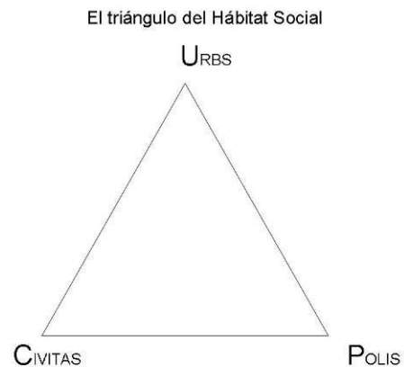
Figura 2: El triángulo del hábitat Social.

Estas tres dimensiones, de la ciudad que entendemos válidas para el hábitat social, sea rural o urbano, se relacionan entre sí de modo dialógico y recursivo. Son complementarias y cualquier transformación en una de ellas es causa de transformaciones en las otras. Con ellas construimos el triángulo del hábitat social (Figura 2).