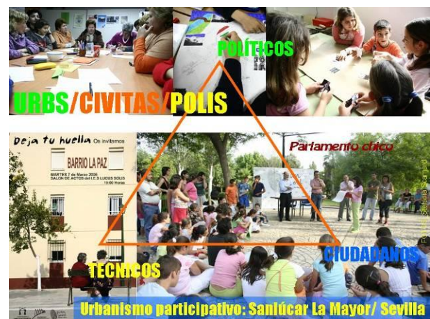
Figura 11: Construcción del triángulo de la gestión social del hábitat en la elaboración del Plan General de Sanlúcar La Mayor (Sevilla). Elaboración propia.

un informe urbanístico que fue presentado como el libro blanco del Aljarafe, acabó solicitando a la administración una moratoria urbanística. Empresarios, nuevos vecinos que han visto frustrado su sueño de un lugar para vivir, ecologistas, universitarios, han creado una emergente polis ciudadana antagónica de los intereses especulativos respaldados por las autoridades municipales ante la pasividad de la administración autonómica. En Sanlúcar La Mayor tuvimos la oportunidad de asesorar a un joven equipo de gobierno municipal que había ganado las elecciones tras liderar la oposición a un salvaje plan municipal. Su consigna era hacer un planeamiento sostenible y participativo. En las mesas de participación surgió la propuesta de mantener el carácter rural de este municipio del segundo cinturón del Aljarafe, limitando los desarrollos urbanísticos a lo necesario para el crecimiento vegetativo de la población y para asentar actividades productivas (Figura 11).