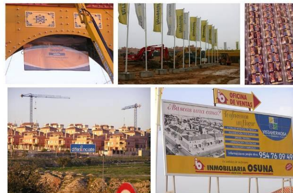
Figura 8: Proceso urbanizador del Aljarafe, en el Área Metropolitana de Sevilla.

La URBS resultante es un territorio desestructurado. Una sucesión de urbanizaciones colgadas del viario local preexistente. La CIVITAS rural se ha visto transformada por un aluvión de nuevos habitantes urbanitas que han venido al Aljarafe comprando el sueño de una casa propia adosada, con jardín, a cinco minutos de Sevilla en urbanización con piscina (Figura 8). Los carteles de las promociones venden un arquetipo de casa andaluza con teja árabe. Sobre un fondo de viviendas clónicas un cartel reza: "diferénciate" (si puedes, que añadiría el autor de la foto).