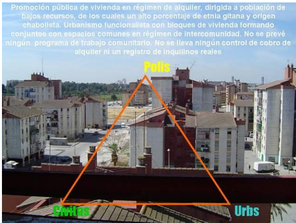
Figura 16: El triángulo del hábitat social en Polígono Sur. Elaboración propia.

paternalista, por una parte, y desresponsabilizada, por otro, ha sido demoledor (Figura 16).