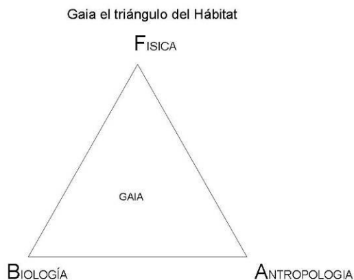
Figura 1: Gaia, el triángulo del hábitat.

Para construir el triángulo de análisis complejo del hábitat nos apoyamos en la “hipótesis Gaia” del biólogo James Lovelock. Este autor nos aporta una perspectiva compleja de la relación entre el medio físico, el biológico y el antropológico. Gaia es el planeta vivo. La vida ha sido posible por unas condiciones físico-químicas de partida, que a su vez han sido modificadas por la aparición de la vida. De modo que la vida desde su aparición ha ido transformando su propio hábitat. A su vez estas transformaciones han propiciado la aparición de formas de vida crecientemente más complejas hasta la aparición del ser humano. El triángulo de GAIA está formado por las interacciones entre el medio físico-químico planetario, los seres vivos que componen la biosfera y el orden antropológico que, como subsistema de la biosfera, introduce una dimensión cultural. Proponemos este triángulo (Figura 1) para el análisis complejo de la relación entre la acción del ser humano, la biosfera y el medio físico planetario.