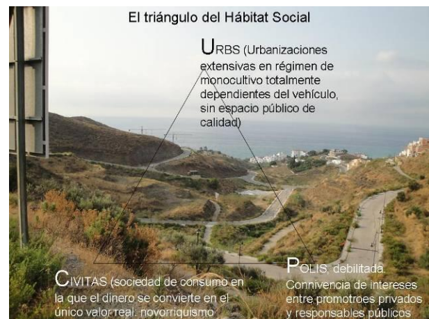
Figura 7: El triángulo del hábitat social de las urbanizaciones extensivas del litoral.

do por una amalgama caótica de urbanizaciones, infraestructuras viarias poco articuladas por las que es difícil orientarse, en las que se suceden promociones clónicas de viviendas, rotondas y centros comerciales. Difícilmente podrán llegar a ser barrios alguna vez, por su excesiva simplificación y segregación de usos, y es casi imposible que aquí emerja una POLIS dada la dificultad de encontrar espacios públicos de convivencia (Figura 7). En ellos es difícil y, cuando menos, aburrido pasear. El triángulo de actores que produce este hábitat está formado por los promotores inmobiliarios, los políticos locales, que ven en este modo de urbanización una forma de financiar sus administraciones locales a corto plazo, y los técnicos de las promotoras privadas y de las administraciones que redactan y aprueban los proyectos. Los ciudadanos quedan reducidos a la categoría de consumidores.