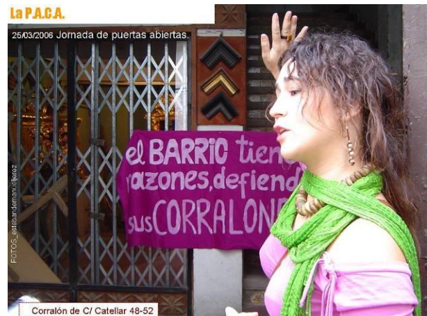
Figura 14: Visita guiada a los corralones artesanales del barrio de San Luis organizada por la Plataforma de Artesanos del Casco Antiguo (Sevilla).