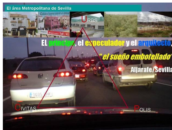
Figura 9: El sueño embotellado. Elaboración propia.

Estos nuevos habitantes han establecido en general muy pocos vínculos con los pueblos en los que se ubican sus urbanizaciones. Su trabajo está en Sevilla, las compras y el ocio se reparten entre la ciudad y los grandes centros comerciales ubicados en los nudos de las autovías. Buena parte de ellos no se empadronan o tardan en hacerlo, por lo que ni siquiera votan a sus alcaldes. El territorio de las metrópolis se compone de vías con rotondas, urbanizaciones, polígonos industriales y centros comerciales. Es casi imposible recorrerlas a pie o en bicicleta. Las redes de transporte público no han sido previstas. Y la dependencia de una ciudad a la que hay que acceder y de la que hay que salir por tres únicos puentes acaba convirtiendo el sueño en pesadilla: atrapados en los atascos para ir y volver del trabajo (Figura 9).