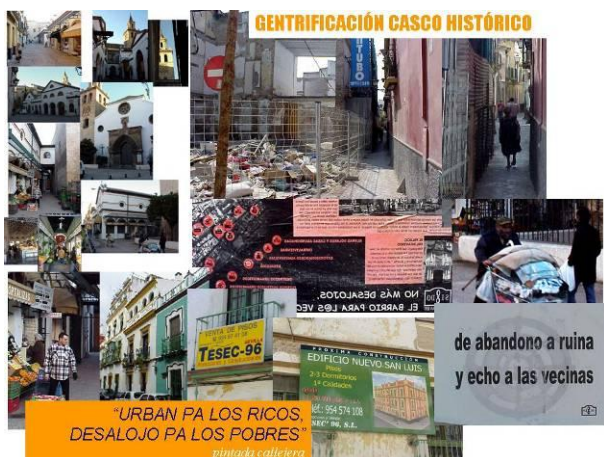
Figura 12: Gentrificación en el Norte del Casco Antiguo de Sevilla. Elaboración propia. Fotografías del autor.

Mientras esto ha ocurrido en los suburbios de clase media de las ciudades, los centros históricos se han visto atacados por procesos de gentrificación (Figura 12). Los inversores han comprendido que el valor simbólico de estas áreas les presta grandes oportunidades para obtener beneficios económicos.