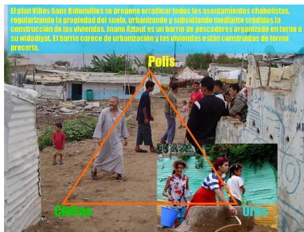
Figura 19: El triángulo del hábitat social en Jnane Aztout, Larache (Marruecos). Elaboración propia. Fotografías del autor.

Mientras tanto, al sur del Estrecho de Gibraltar, en Larache, ciudad de la costa atlántica de Marruecos, en las últimas décadas se está produciendo un intenso proceso de migración desde el campo a la ciudad y desde la ciudad hacia Europa (CIVITAS). Esto ha dado lugar a un cinturón de bidonvilles que rodean las ciudades consolidadas (URBS). El estado marroquí lanzó en 2004 el Plan Villes Sans Bidonvilles con el objetivo de declarar las ciudades libres de chabolas en 2008 (POLIS). Al tiempo, el boom inmobiliario especulativo (CIVITAS) ha llegado a la ciudad, que carece de plan de ordenación urbana (POLIS). Uno de estos bidonvilles , Jnane Aztout (Figura 19), de más de ochenta años de antigüedad, ubicado como un arrabal de la Medina, en la colina que domina el puerto pesquero (URBS), se vio amenazado por estos procesos especulativos (CIVITAS). (De Manuel, 2009; Ojeda y De Manuel, 2009)