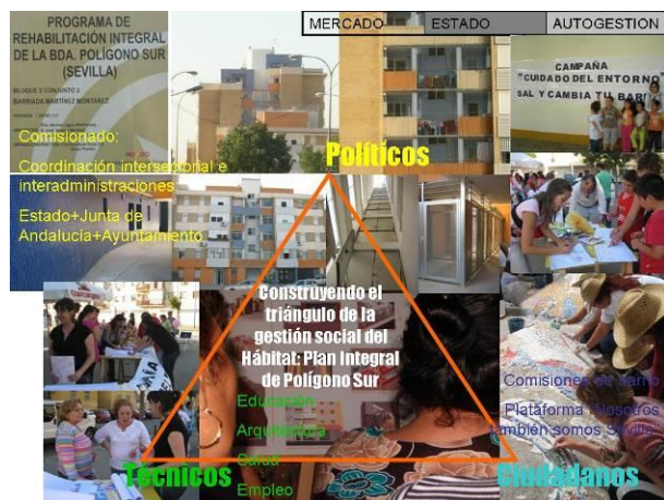
Figura 18: Construcción del triángulo de la Gestión social del Hábitat en el Plan Integral de Polígono Sur. Elaboración propia.

cuatro ejes de intervención: urbanismo y convivencia; salud comunitaria, intervención socioeducativa y familiar, inserción sociolaboral; e iniciativa económica (Comisionado para Polígono Sur, 2004).