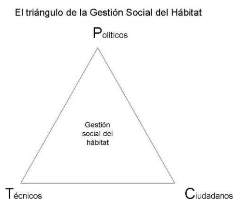
Figura 3: El triángulo de la Gestión Social del Hábitat.

En tercer lugar destacamos al conjunto de los ciudadanos como usuarios demandantes de necesidades en materia de hábitat, como promotores o como autogestores.