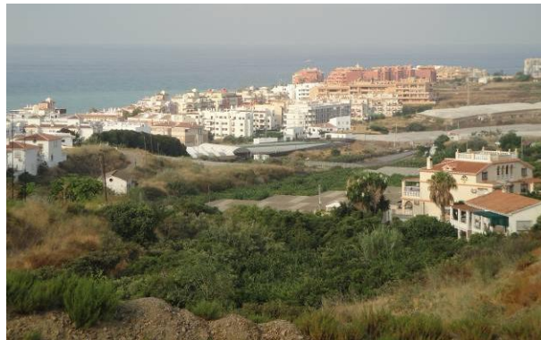
Figura 5: Cultivos subtropicales entre urbanizaciones. Fotografía del autor.

ral. El clima mediterráneo subtropical permite una agricultura singular en Europa, a base de aguacates, chirimoyas, mangos... que, aun retrocediendo ante el avance del Tsunami Urbanizador , se resiste a desaparecer (Figura 5).