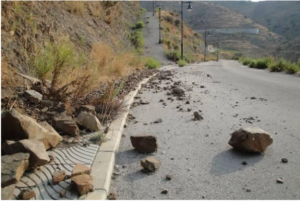
Figura 6: Urbanización sin edificar y en estado abandonado.

El caso de Sunny Hills nos ilustra sobre los efectos del urbanismo salvaje de la última década en España. Casi la mitad de lo que se ha construido en Europa lo ha sido en este país. Todo suelo no parecía tener mejor destino que urbanizarse. Todo lo que se construía se vendía en planos y pasaba de mano en mano. Hasta que se detuvo la música y nos dejó un paisaje de casas vacías con el cartel de (NO) SE VENDE, de urbanizaciones con las calles terminadas para ofrecer parcelas que vender. Despilfarro de recursos materiales, paisajísticos y financieros. Paro masivo. Simultáneamente más de la mitad de las familias españolas encuentran problemas para acceder a una vivienda. La ley de la oferta y la demanda no ha estado dirigida a satisfacer la necesidad de viviendas para vivir. El mercado ha mostrado su ceguera, con la colaboración activa y/o pasiva de técnicos y responsables públicos de urbanismo en todos los niveles de la administración. El stock de más de un millón de casas de reciente promoción sin vender está situado donde no se necesitan para vivir, allí donde las inversiones resultaban más atractivas, en el litoral y en las coronas metropolitanas de las ciudades. Esta CIVITAS de nuevos ricos y adoradores del becerro de oro ha producido una URBS muy simple, monocultivo de viviendas, absolutamente dependientes de los desplazamientos en coche para aprovisionarse en los centros comerciales de lo preciso. El territorio se ha visto invadi-