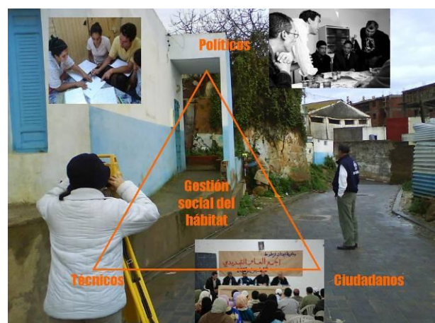
Figura 21: El triángulo de la gestión social del hábitat en Jnane Aztout, Larache (Marruecos). Elaboración propia.

Los vecinos, pescadores en su mayoría, están plenamente insertados en la ciudad e identificados con el lugar en el que viven y están muy organizados y cohesionados para defender sus derechos. Esta organización más el conocimiento construido conjuntamente sobre su realidad y la estrategia de colaboración consiguiente, más el respaldo institucional de la universidad, permitió a los vecinos que se les reconociera como interlocutores ante las autoridades marroquíes e ir ganando progresivamente el respaldo de sus autoridades a un proyecto que ha sido asumido por éstas como una acción piloto de transformación urbana participativa.