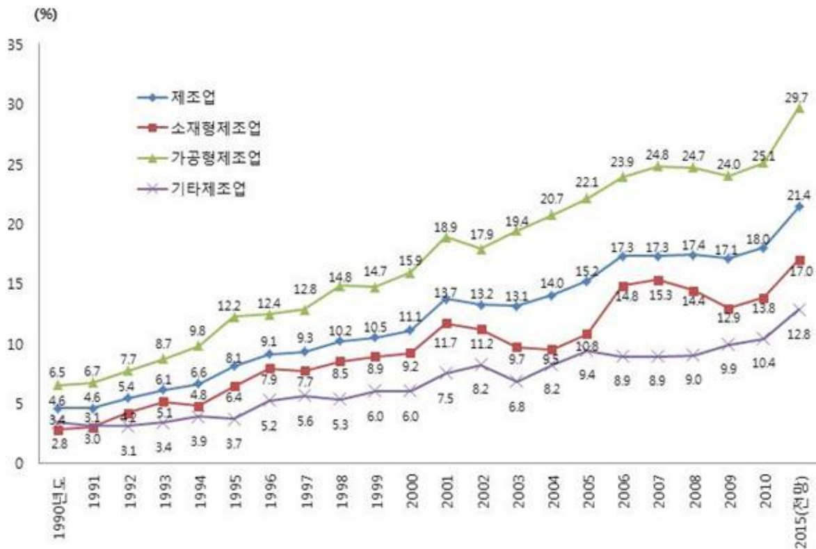
<해외 현지생산 비율의 추이>