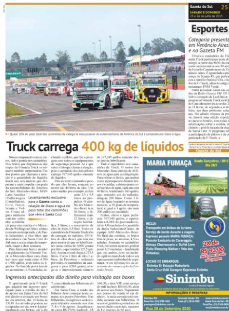
Imagem 18 - Pedido atendido e Fórmula Truck nas páginas do jornal