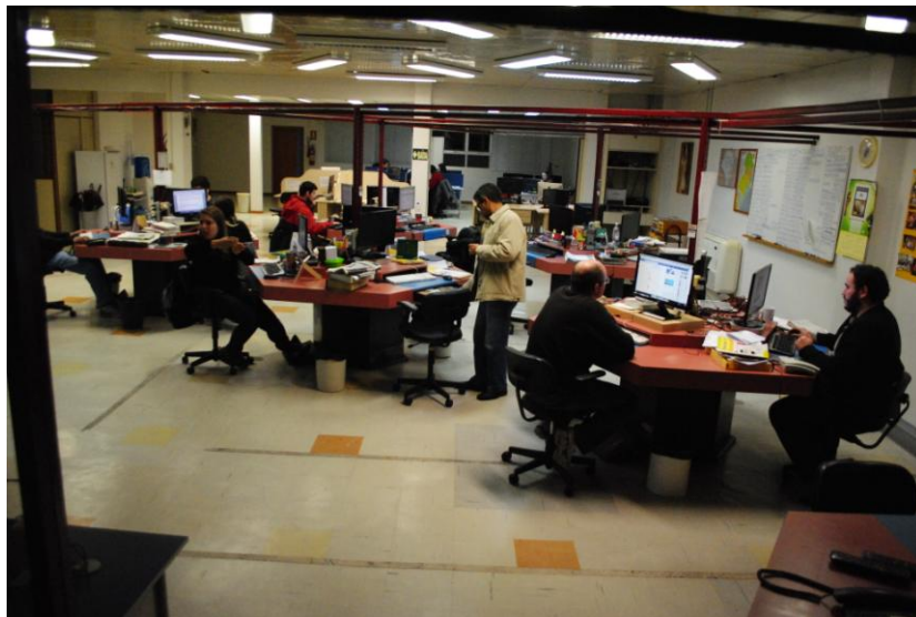
Foto 11 - Redação da Gazeta do Sul