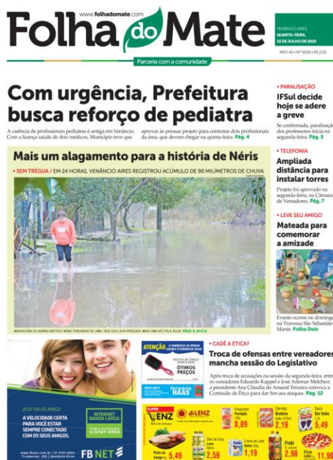
Imagem 16 - Foto chamativa na capa