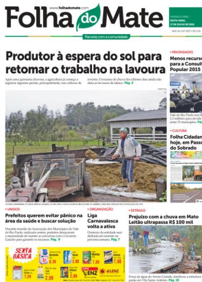
Imagem 15 - Chamada com caráter positiva na capa