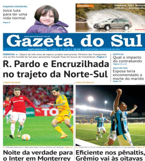
Imagem 30 – Dupla Gre-Nal na capa