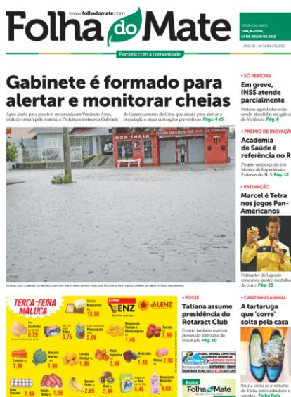
Imagem 14 - Marcel Stürmer na capa da Folha do Mate