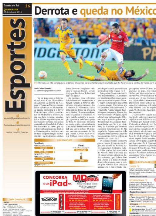
Imagem 17 - Eliminação colorada nas páginas da Gazeta do Sul