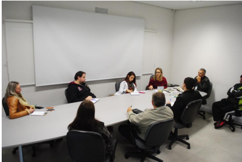
Foto 2 - Reunião de pauta na Folha do Mate