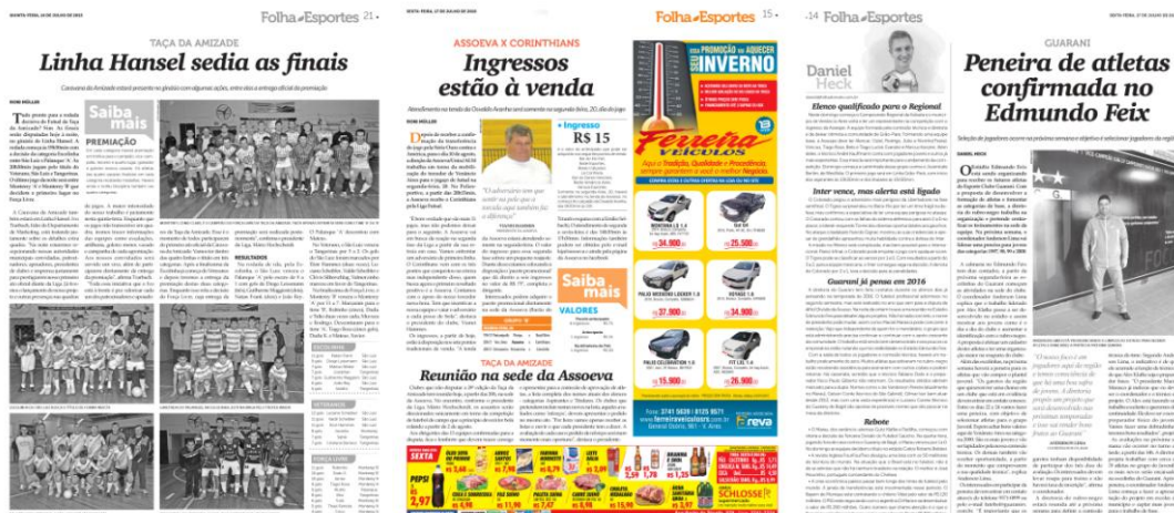
Fonte: Folha do Mate (p. 21, 16 jul.; p. 15, 17 jul.; p. 14, 17 jul. 2015).

Na editoria de agricultura se verifica uma utilização viciante de órgãos governamentais como fonte para as matérias – exemplos são a Secretária Municipal de Agricultura de Venâncio Aires e Emater/Ascar.