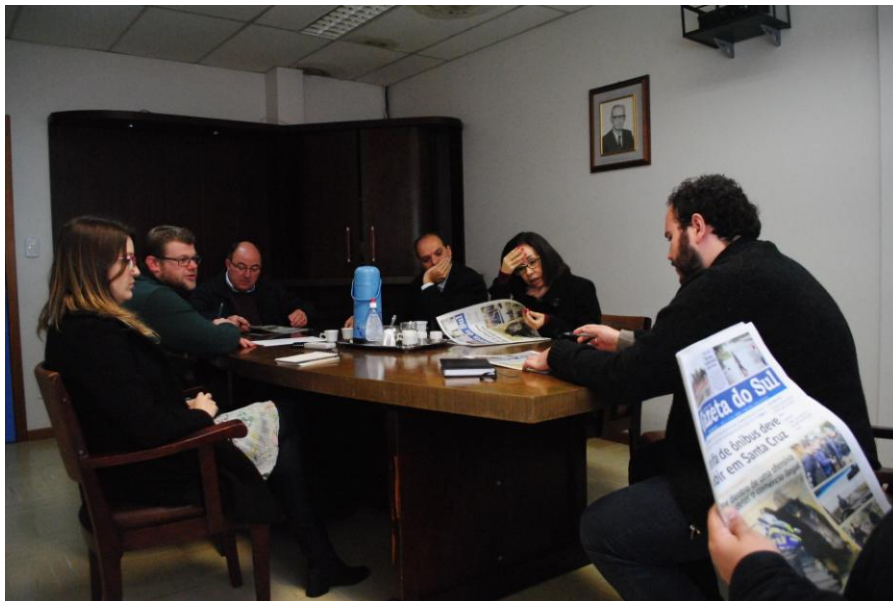
Foto 7 - Reunião de pauta na Gazeta do Sul