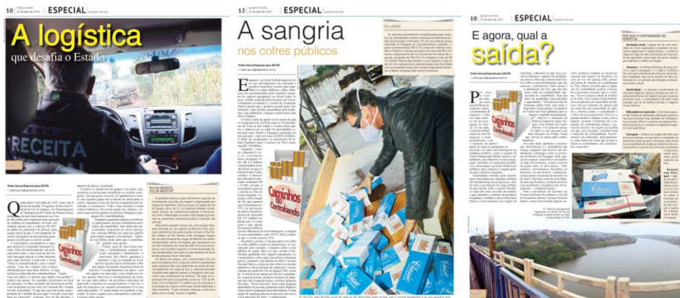
Imagem 22 - Série de matérias Caminhos do Contrabando