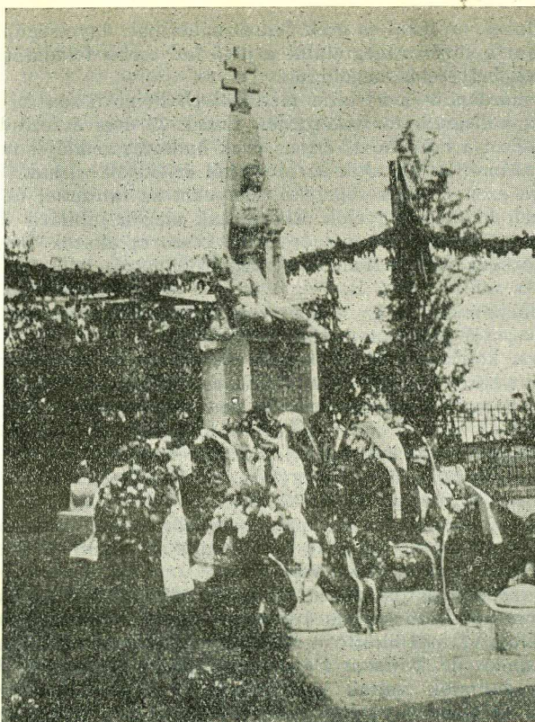
— A szegedi rk. ttóképző elesett tanulói emlékére állított hősi emlékmű a felavatás után. —