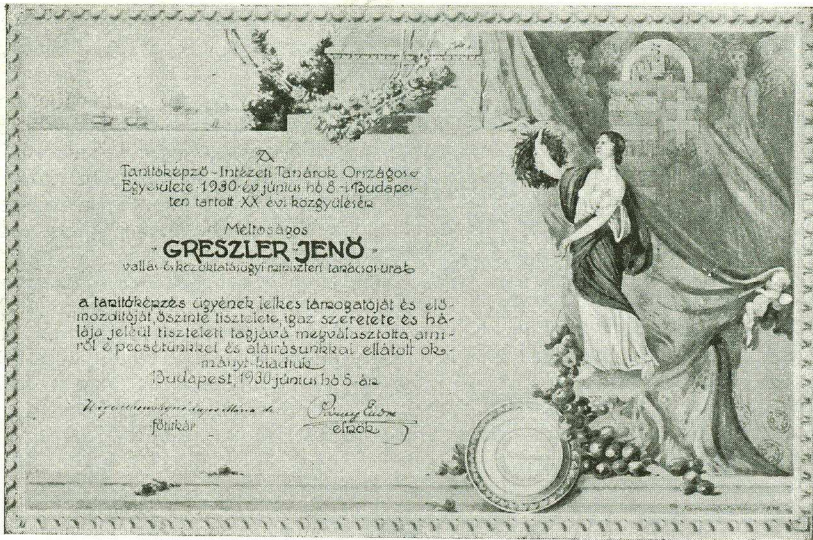
Greszler Jenő min. tanácsos tiszteletbeli tagsági oklevele. — Rajzolta Farkasdy Zoltán.

a részvénytársaságok alapítási módja ismertetésénél teszi, mert a szövetkezetek ügye közelebb áll a tanítósághoz, ilyenek vezetésében s alapításában a tanító nem egy helyen aktív szerepet tölt be.