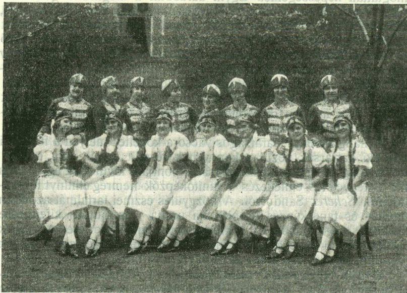
A NÉPIES DALOS JÁTÉKOK bemutatói.

— Egyesületi hangversenyünkön előadták az áll. óvónőképző növendékei. —