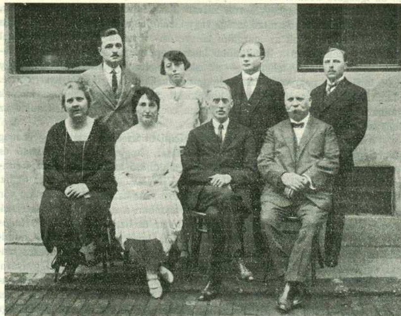
— Egyesületünk céljaira adott hangverseny rendezősége. —

A IV. sz. táblázat megvalósításával visszahelyeztetvén mindazon fizetés jellegével bíró jogainkba, melyeknek 1912-ben már birtokában voltunk: áttérhetünk a jövődő célkitűzéseinek megbeszélésére. Nem lévén olyan műszer, mellyel a tanári munka abszolút értéke megmérhető, munkánk értékelésének megmérésére marad a régi módszer: helyzetünknek más státusokkal való összehasonlítása. Önként kínálkozó szempontok: 1. a tanári munka értékelése a multhoz, tehát az 1912. évi státusállapothoz képest; 2. helyzetünk az oktatószemélyzet egyéb státusaihoz viszonyítva s végül 3. helyzetünk a hasonló képesítésű idegen státusokhoz képest.