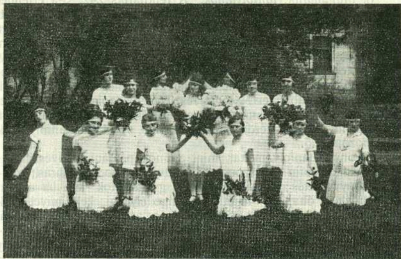
A MAGYAR CSOKOR c. táncjelenet szereplői.

Egyesületi hangversenyünkön előadták a budai tanítóképző növendékei.