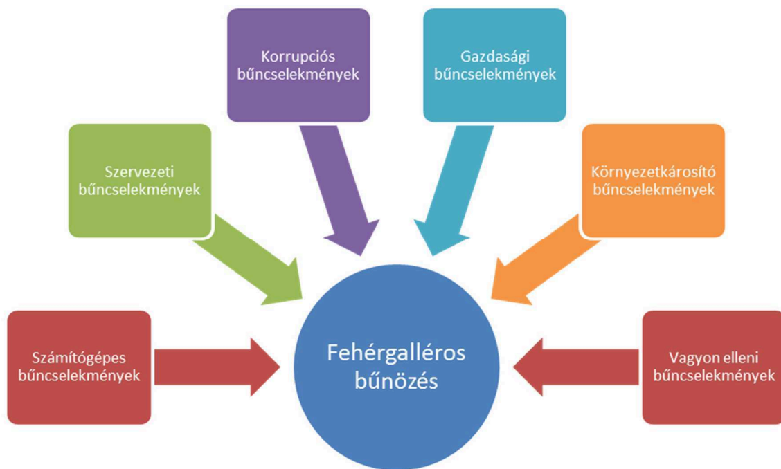
1. számú ábra A fehérgalléros bűncselekmények főbb típusai

A fehérgalléros bűnözés és a korrupció kapcsolatrendszerét, vagyis a korrupciós tranzakciókban résztvevők hálózatát az alábbi gráfon ábrázoltam (lásd 2. számú ábra).