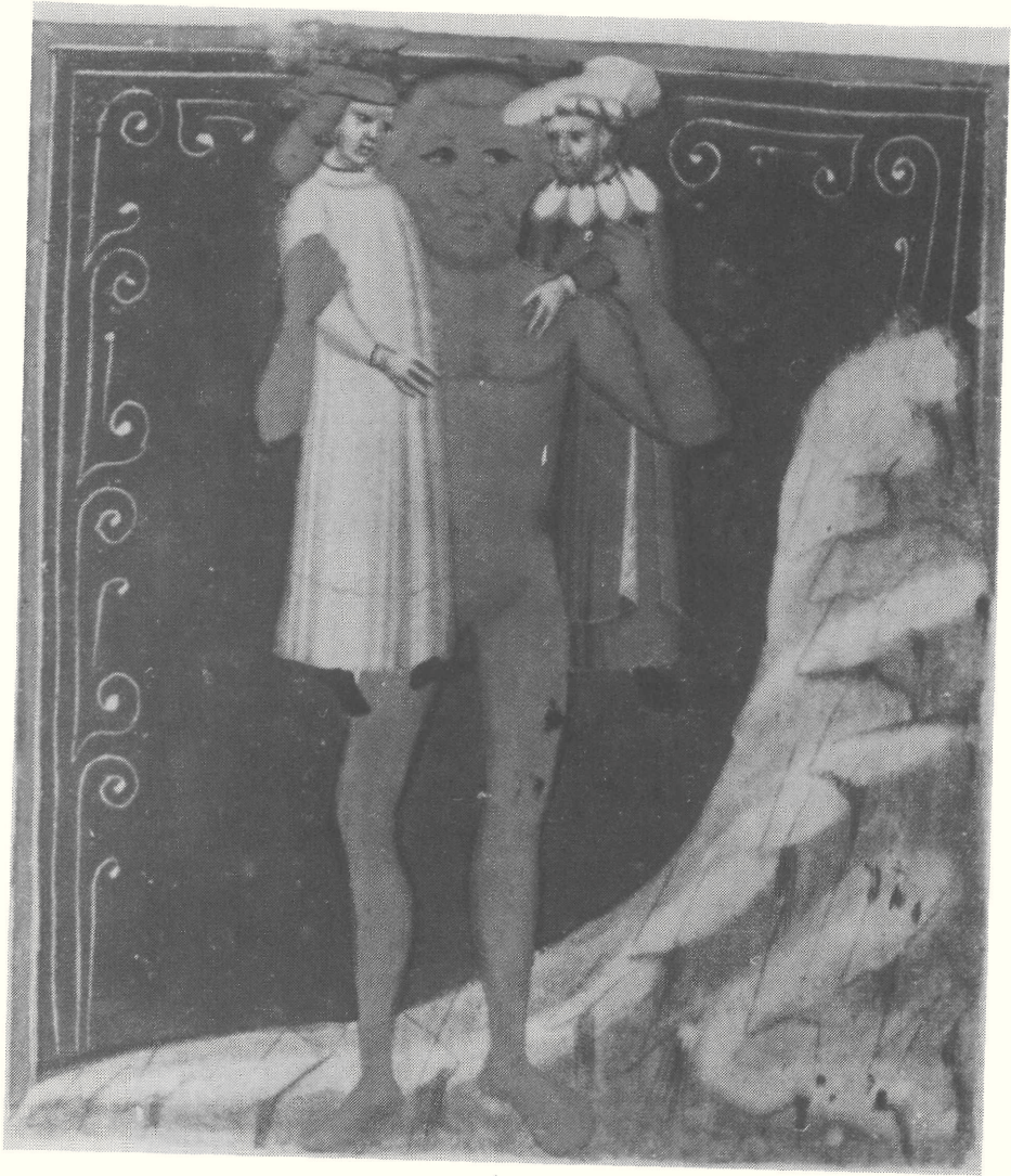
Anteusz Dantét jobb vállára emeli, bal vállára támasztva Vergiliuszt tartja. Dante Alighieri: Divina Comoedia. Cod. Ital 1. 25a - miniatura - 1345 körül - 88 x 70 mm