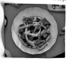
makaruli koji su u pripremi i spremni za konzumiranje

Šporki makaruli tradicionalno je jelo drevnog kraja. Otkriva se da imaju vrlo nježan okus i vrlo su zdrave. Šporki makaruli su vrlo zdravi i imaju vrlo nježan okus. Šporki makaruli su vrlo zdravi i imaju vrlo nježan okus. Šporki makaruli su vrlo zdravi i imaju vrlo nježan okus. Šporki makaruli su vrlo zdravi i imaju vrlo nježan okus.