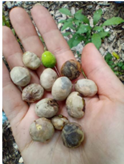
Figura 3 Árbol y frutos de guáimaro.