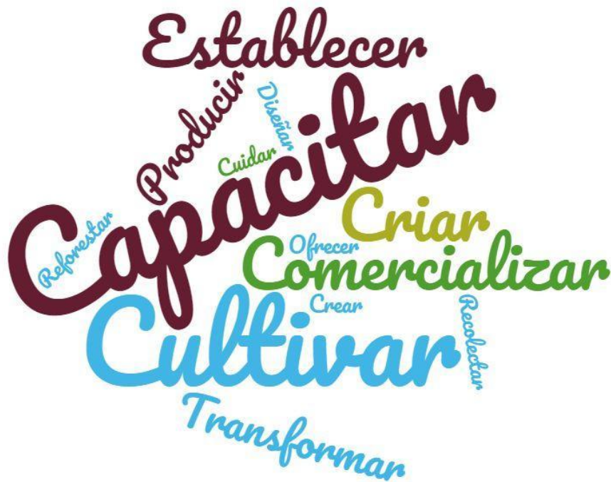
Figura 1 Prácticas más recurrentes

comercializar, aunque esta última no se repite con tanta frecuencia.