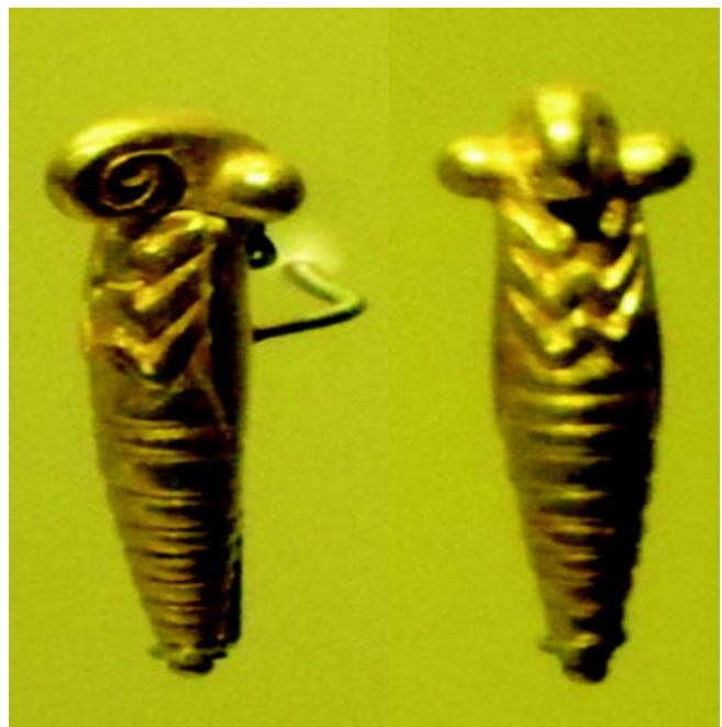
Figura 3. Larvas de insectos. Cultura Quimbaya. Museo del Oro, Bogotá D.C.