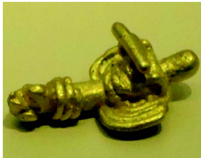
Figura 6. Animal quimérico con rasgos de insecto. Ofrenda Muisca. Museo del Oro, Bogotá D.C.

En el primero de los platos Nariño (Figura 7), propiedad del Museo Arqueológico de la Casa del Marqués