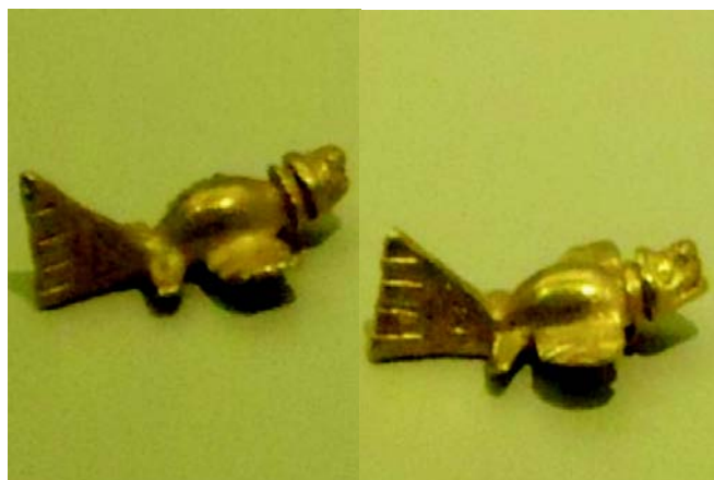
Figura 5. ¿Seres fantásticos, quiméricos, que reúnen aspectos de jaguares, peces voladores, peces e insectos? Skipers (lepidóptero). Cultura Tolima. Museo del Oro, Bogotá D.C.

y en el otro de un insecto (Figuras 7, 8 y 9); una vasija funeraria Tolima de un ser con cola de escorpión (Figura 10), un silbato Tairona con forma de escarabajo (Figura 11) y una piedra Tairona con forma de pupa (Figura 12).