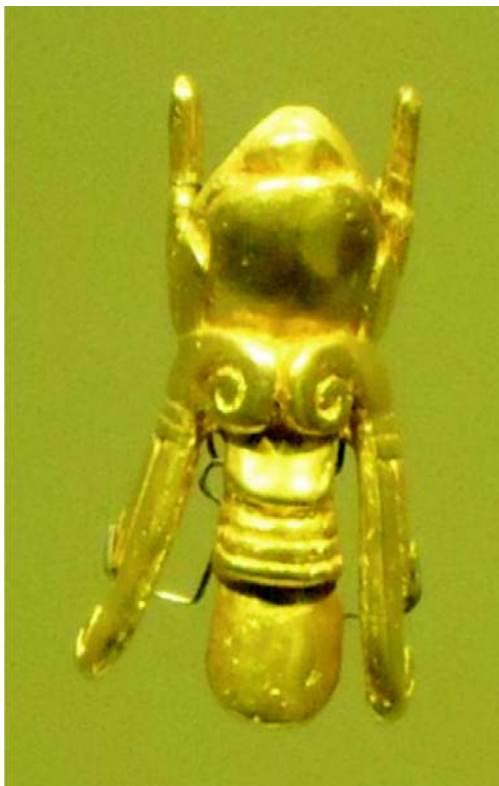
Figura 1. Insecto. Cultura Tolima, Museo del Oro, Bogotá D.C.