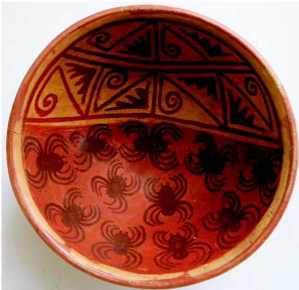
Figura 8. Plato funerario del altiplano nariñense del complejo cultural Tuza (1250 -1500 d. C.). Colección particular, Bogotá D.C.

En una vasija Tolima bellamente decorada en toda su superficie, se ve en uno de sus lados una figura estilizada que recuerda a un escorpión; mientras que en un pito de cerámica Tairona se aprecia un escarabajo y en una piedra cornalina está representada una pupa ( Figuras 10, 11 y 12 ).