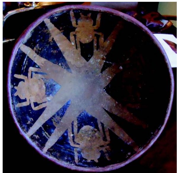
Figura 9. Plato funerario del altiplano nariñense del complejo cultural Tuza (1250 -1500 d. C.) que representa a un insecto. Colección particular, Bogotá D.C.