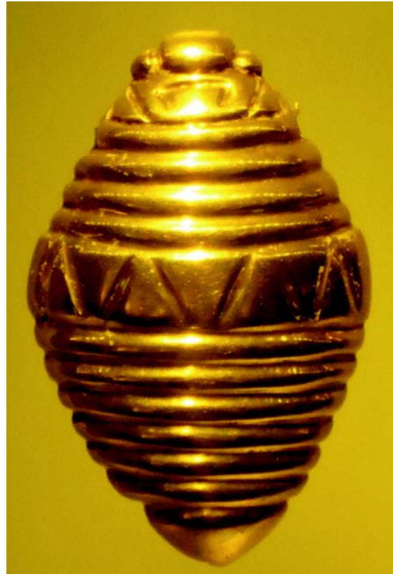
Figura 2. ¿Crisálida de una mariposa? ¿Larva de noche? Pieza de oro de la Cultura Quimbaya, Corinto, Cauca. Museo del Oro, Bogotá D.C.

El autor de estas líneas después de visitar varias veces los Museos del Oro y Arqueológico de la Casa del Marqués de San Jorge, en Bogotá D.C., ver varias colecciones particulares de arte prehispánico colombiano y revisar textos de arqueología colombiana, escogió catorce piezas, ocho de oro y seis de cerámica, que representan artrópodos. El estado adulto se muestra como un insecto en una pieza de oro de la cultura Tolima ( Figura 1 ); en otro insecto en un plato de cerámica Nariño, en unas arañas en dos platos de cerámica de Nariño, en forma esquemática de escorpión en una vasija Tolima y en un escarabajo en una pieza cerámica de la cultura Tairona; la metamorfosis de los insectos está registrada en una pieza de oro de la cultura Tolima que representa ya sea una crisálida de mariposa o una larva de noche ( Figura 2 ); en dos piezas de oro Tolima como larvas ( Figura 3 ) y en una piedra de la cultura Tairona co-