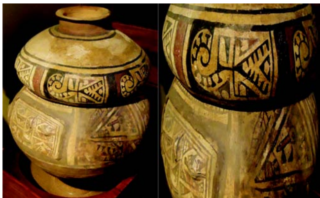
Figura 10. Vasija funeraria Tolima con figura que recuerda un escorpión. Colección particular, Bogotá D.C.