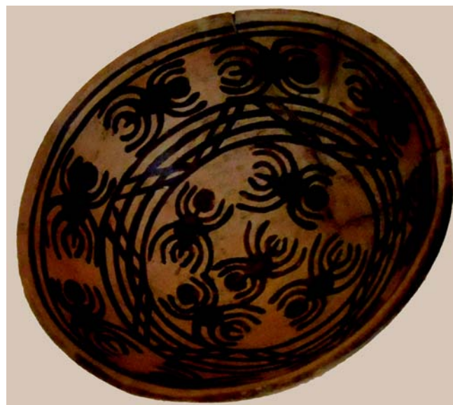
Figura 7. Plato funerario del altiplano nariñense del complejo cultural Tuza (1250 - 1500 d. C.). Museo Arqueológico de la Casa Marqués de San Jorge, Banco Popular, Bogotá D.C.