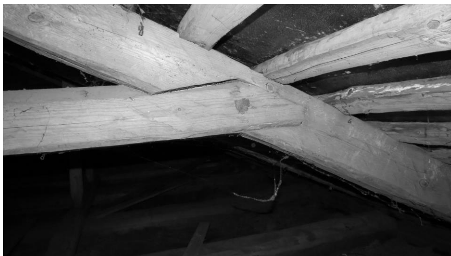
Рисунок 4. – Крепление затяжки к стропильной ноге

нагелей и других подобных элементов связано с производившимися в более позднее время ремонтами здания. Присутствие крайне малого количества металлических крепежных элементов, по сравнению с современными зданиями (1–10 % от общего объема для современных сооружений) объясняется достаточно высокими для начала XIX в. ценами на металл.