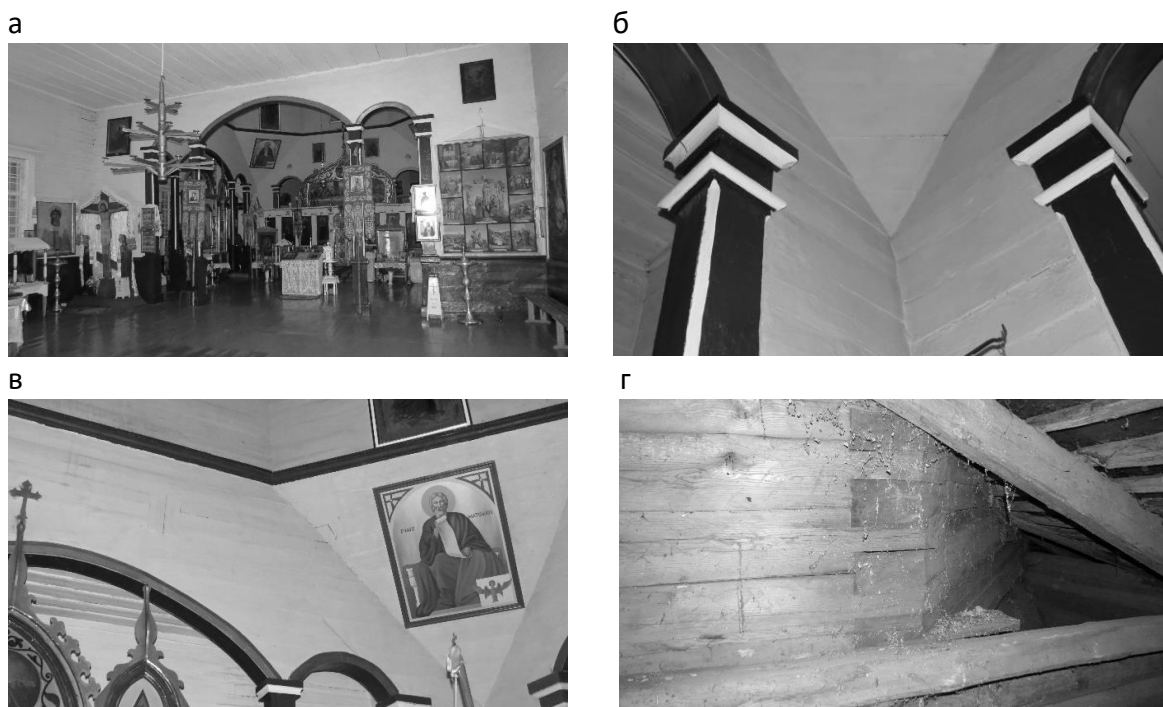
а – арочные проемы в алтарной части; б – имитация капителей в завершении столбов; в – переход прямоугольного сруба основания в восьмигранный барабан (вид изнутри); г – переход прямоугольного сруба основания в восьмигранный барабан (вид со стороны стропильной системы бабинца)

прямоугольного сруба основания в восьмигранный несущий барабан (рисунки 2 в, г), также представляющий собой сруб, выполненный из брусьев. Основной его функцией является опирания конструкции купола и освещение церкви за счет четырех прямоугольных оконных проемов. Отметка верха барабана – 10,2 м от уровня пола, а расстояние между его торцевыми стенами составляет 8 м. Следовательно, внутренний радиус полуарок купола, при отметке самой высокой точки купола от уровня пола равной 12 м, составляет порядка 3,1 м, а длина арки 4,9 м. Сомкнутый купол, также как и барабан, выполнен граненым с опиранием несущих полуарок непосредственно на стены барабана через прирубы. Общий принцип его конструирования совпадает с устройством купола над звонницей только в увеличенном по сравнению с ним варианте, что позволяет говорить об унификации конструктивных элементов и архитектурных деталей здания.