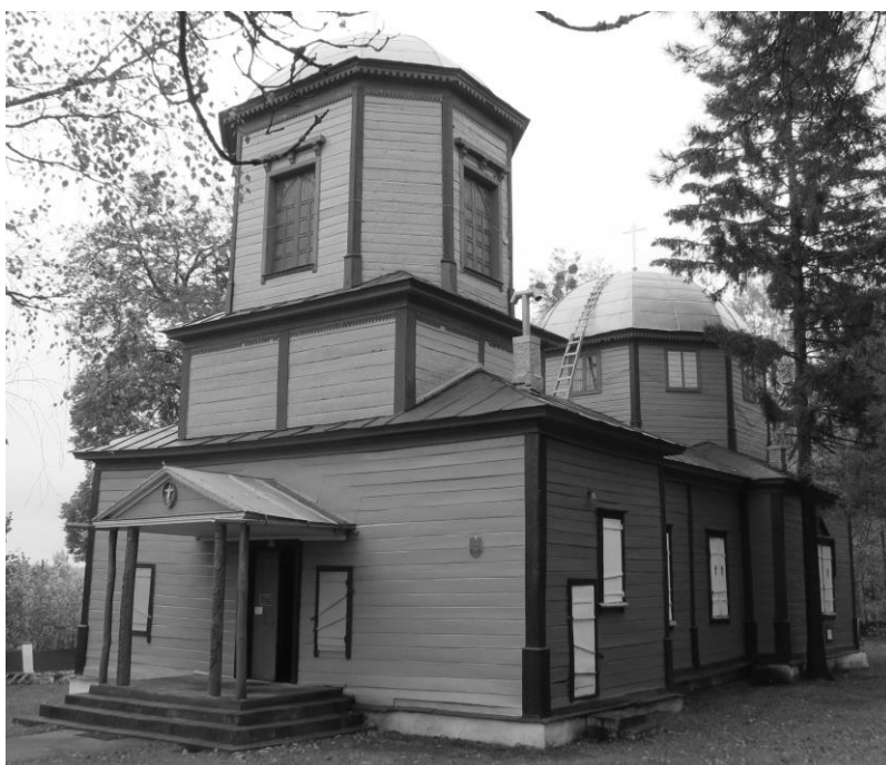
Рисунок 1. – Церковь святых Козьмы и Демьяна

и опирается на каменный фундамент (рисунок 1). Композиционно храм является продольно-осевым, протяженным и состоит из прямоугольного основного объема, трёхъярусной звонницы, пятигранной аспиды и бабинца, а также боковые элементы притвора и приделов [1, с. 174]. В конструкции церкви имеется два полусферических купола: первый венчает звонницу и установлен на восьмигранном основании над притвором, второй, более крупный, расположен прямо над средокрестием и опирается на восьмигранный барабан условным диаметром 8 м, переходящий в основании в конструкцию основного объема. В некоторых источниках годом постройки храма называют 1866 [2, с. 116]. Это связано с тем что в это время церковь подверглась серьезной перестройки ввиду неудовлетворительного технического состояния отдельных конструктивных элементов и получила звонницу в качестве пристройки.