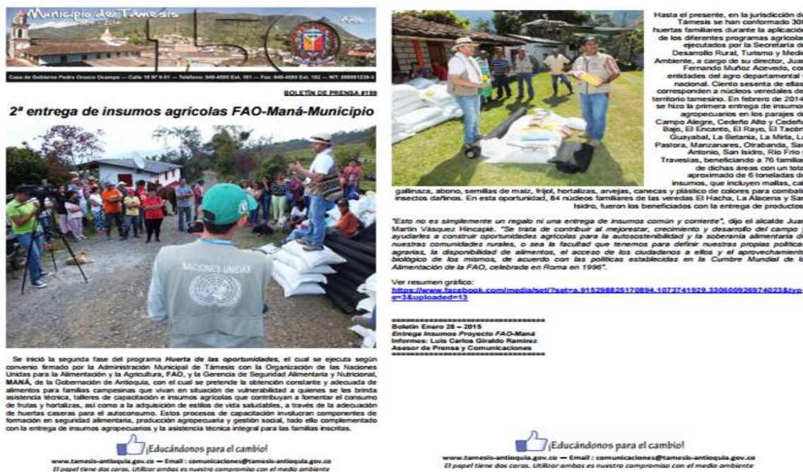
Figura 4.4. Boletín de Prensa