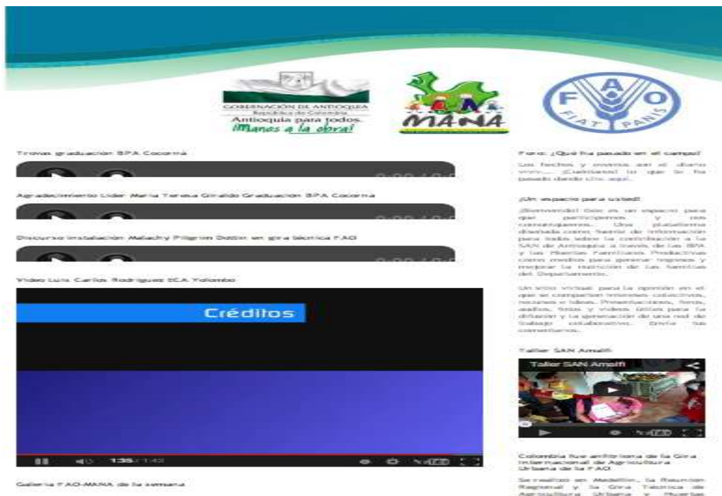
Figura 4.5. Blog Proyecto MANÁ-FAO