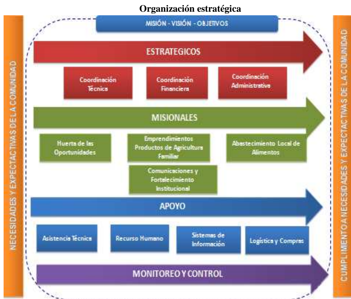
Figura 4.1. Organización estratégica, misional y logística

Para su funcionamiento existe un cuadro resumen donde se presenta las necesidades de la población, los aspectos estratégicos: misión, visión y objetivos; la estructura misional con las coordinaciones técnica, financiera y administrativa y los coordinadores de los 3 componentes ya mencionados. Por último se encuentra el apoyo técnico, humano y logística para la ejecución del convenio y de manera transversal se encuentra el monitoreo y control. Igualmente en el convenio está establecida la jerarquización del talento humano y los procesos a realizar. (Ver figura 4.1).