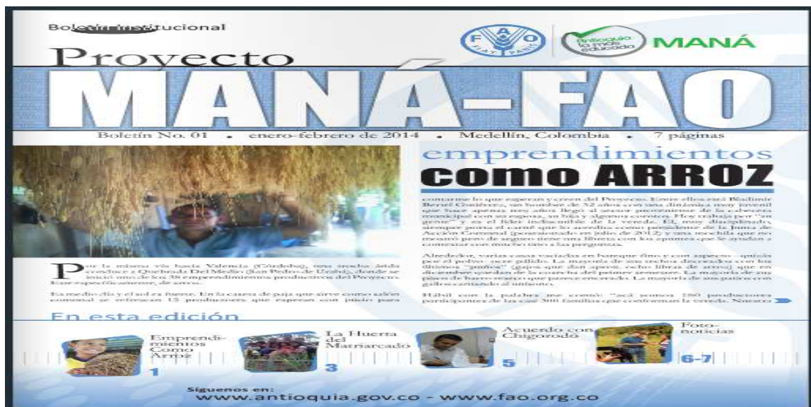
Figura 4.3. Boletín Institucional

A continuación se presentan las gráficas de dos boletines y de un blog creados para difundir la información.