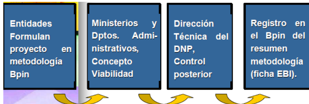
Figura 1. Flujos de información del BPIN en el nivel Nacional