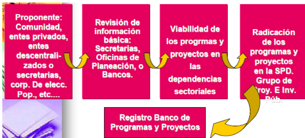
Figura 2. Flujo de información del Banco de Programas y Proyectos en el nivel Departamental / Distrital / Municipal