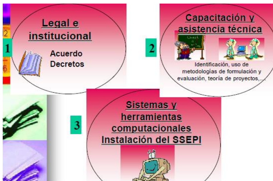
Figura 5. Cómo estamos trabajando en el Departamento de Santander?