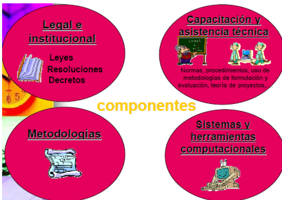
Figura 3. Tercera Etapa: Consolidación del Sistema Nacional de Gestión de Programas y Proyectos de Inversión Pública, Sinagep.