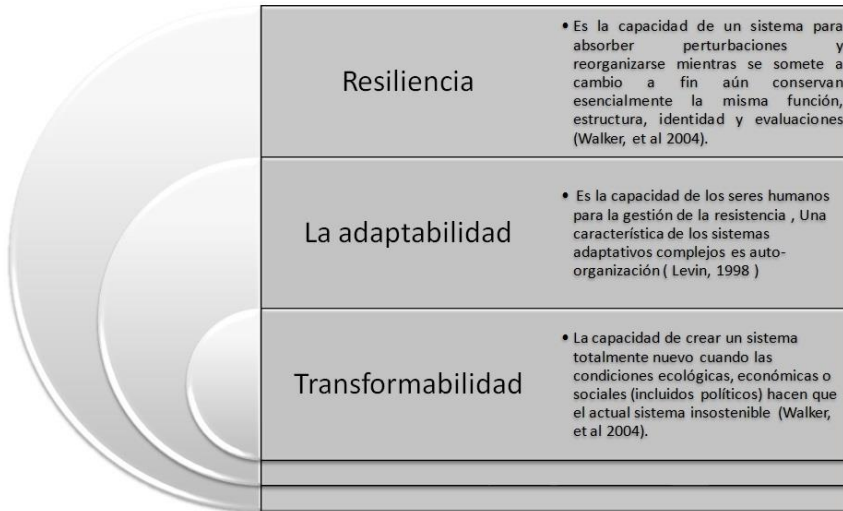
Figura 1. Atributos de los sistemas socio ecológicos.

Los SES se caracterizan por tres atributos que determinan su evolución: la resiliencia, la capacidad de adaptación y la transformabilidad (figura 1) [19, 20]. Aquí la resiliencia y la capacidad de adaptación se relacionan con la dinámica de un sistema, o sistemas estrechamente relacionados.