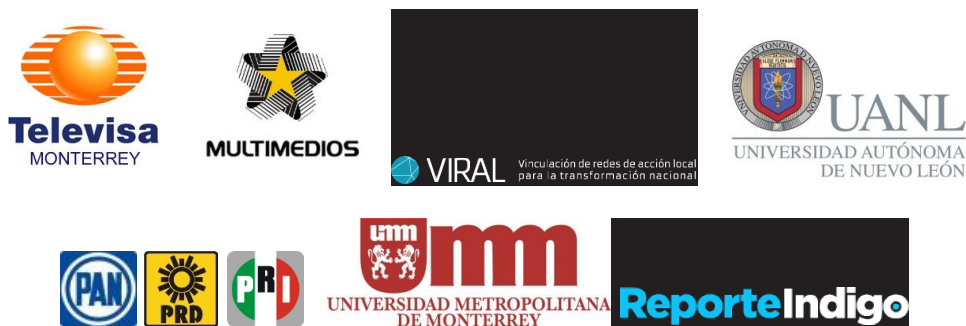
Diagrama 1. Sujetos según vinculación institucional

El contenido de las entrevistas se presenta en las siguientes cinco áreas de estudio; agentes socializadores, función de los medios masivos de comunicación, información electoral, participación ciudadana y cultura política. Con la definición de los entrevistados y de estas categorías, se consideró que se cubrían los cinco aspectos rectores. Posteriormente, se procesaron empleando el software NVivo. Los entrevistados estaban vinculados a las empresas y organizaciones arriba presentadas, con ello se logró, diferenciar los cuatro grupos de actores: