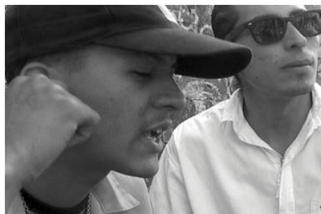
Figura 4. Narcopoetas. Montecristo RIP y el Cuervo. 2005.