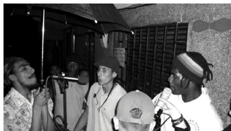
Figura 7. Grabando a los Narcopoetas en la calle con lluvia. 2005.