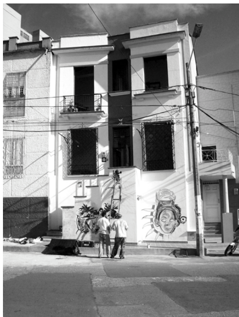
Figura 6. Casa Taller Platohedro. Miércoles 27 de Junio de 2007. www.platohedro.blogspot.com