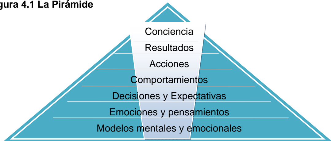
Figura 4.1 La Pirámide

Es evidente que para mejorar los resultados que obtenemos debemos cambiar las acciones que realizamos (interacciones en el ámbito empresarial). Para ello debemos comprender que dichas acciones e interacciones no son realizadas caprichosamente, sino que son el producto del comportamiento, hábitos, actitudes de la persona o equipo.