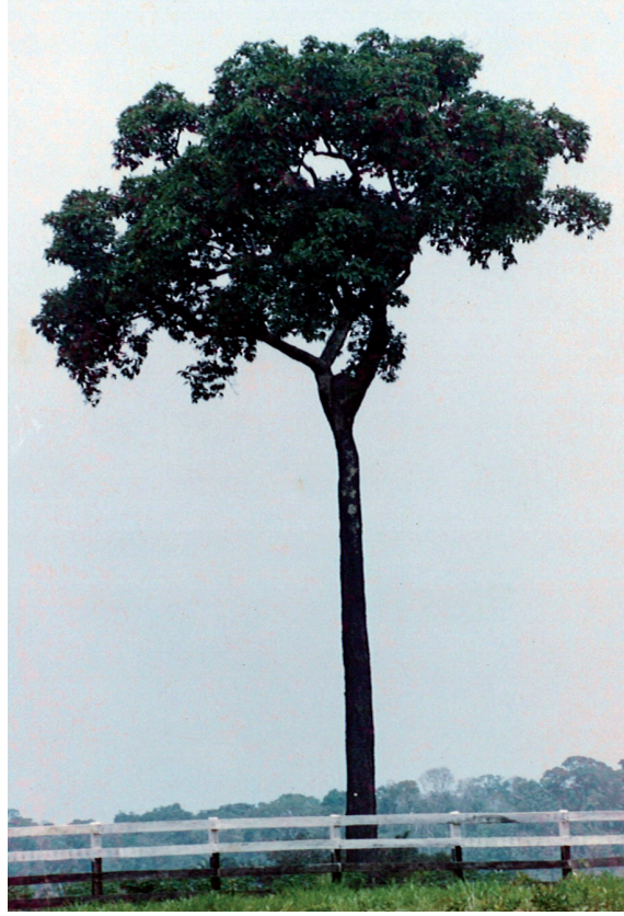
Senador Guiomard, AC