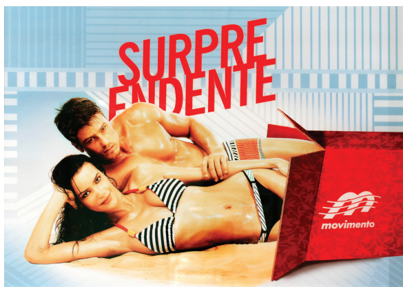
Figura 2: Peça da campanha Surpreendente (2008)

A partir de agora passamos a apresentar os mitos a que chegamos por meio de tal procedimento. Cada um deles é discutido em suas várias facetas e ilustrado por meio das peças publicitárias de onde foram inferidos. Em seguida, apresentamos a análise diacrônica e sincrônica, dedicadas, respectivamente, à investigação dos mitos quanto à sua evolução ao longo das campanhas e com respeito às relações que nutrem entre si.