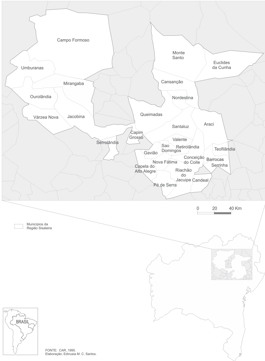
Figura 1 REGIÃO SISALEIRA SEGUNDO A CAR/BAHIA, 1994