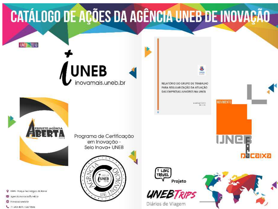
Figura 3 – Catálogo de Ações da Agência UNEB de Inovação em 2018

Fonte: Elaborada pelos autores deste artigo (2019)