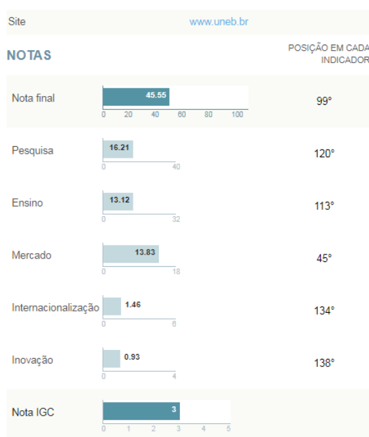
Figura 1 – Ranking da UNEB no RUF

A última pesquisa do Jornal Folha de S. Paulo sobre a inovação nas universidades brasileiras trouxe dados importantes sobre o tema. No ranking de universidades estão classificadas as 196 universidades brasileiras, públicas e privadas, a partir de cinco indicadores: pesquisa, internacionalização, inovação, ensino e mercado (RIGHETTI et al. , 2018). No ano de 2018, as três primeiras colocadas foram a Universidade de São Paulo – USP, seguida da Universidade Federal do Rio de Janeiro – UFRJ e da Universidade Federal de Minas Gerais – UFMG, respectivamente. A UNEB se encontra atualmente, de acordo com o ranking , na posição 99ª e, especificamente em relação ao quesito inovação, a instituição ocupa a 138ª colocação, como pode ser observado na Figura 1.