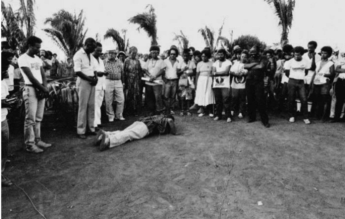
Figura 3 - Abdias do Nascimento beija o solo do Quilombo de Palmares (Serra da Barriga).