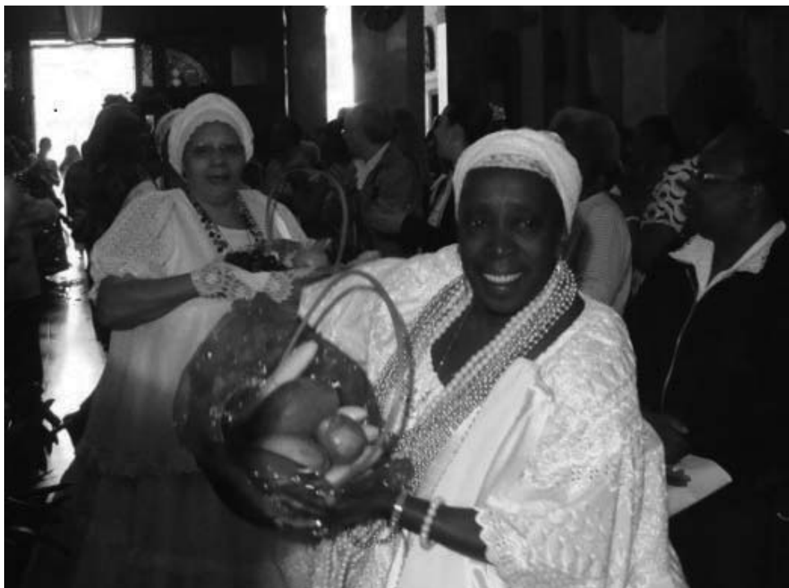
Figura 5 - Ofertas de alimentos durante missa afro na Igreja da Achiropita, São Paulo.