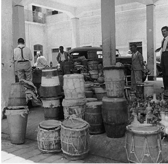
[Figura 2 A]