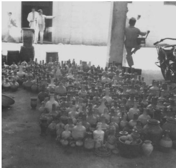
[Figura 2 B]