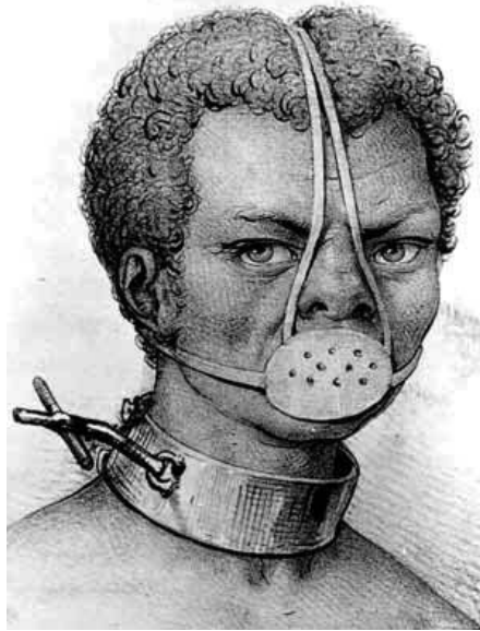
Figura 6 - “Castigo de escravos”, de J. E. Arago e N. Maurin, 1839.