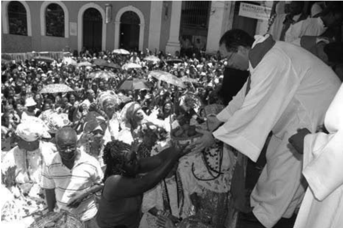
Figura 9 - Festa de Santa Bárbara - Iansã, Igreja de Nossa Senhora do Rosário dos Homens Pretos, Pelourinho, Salvador, Bahia