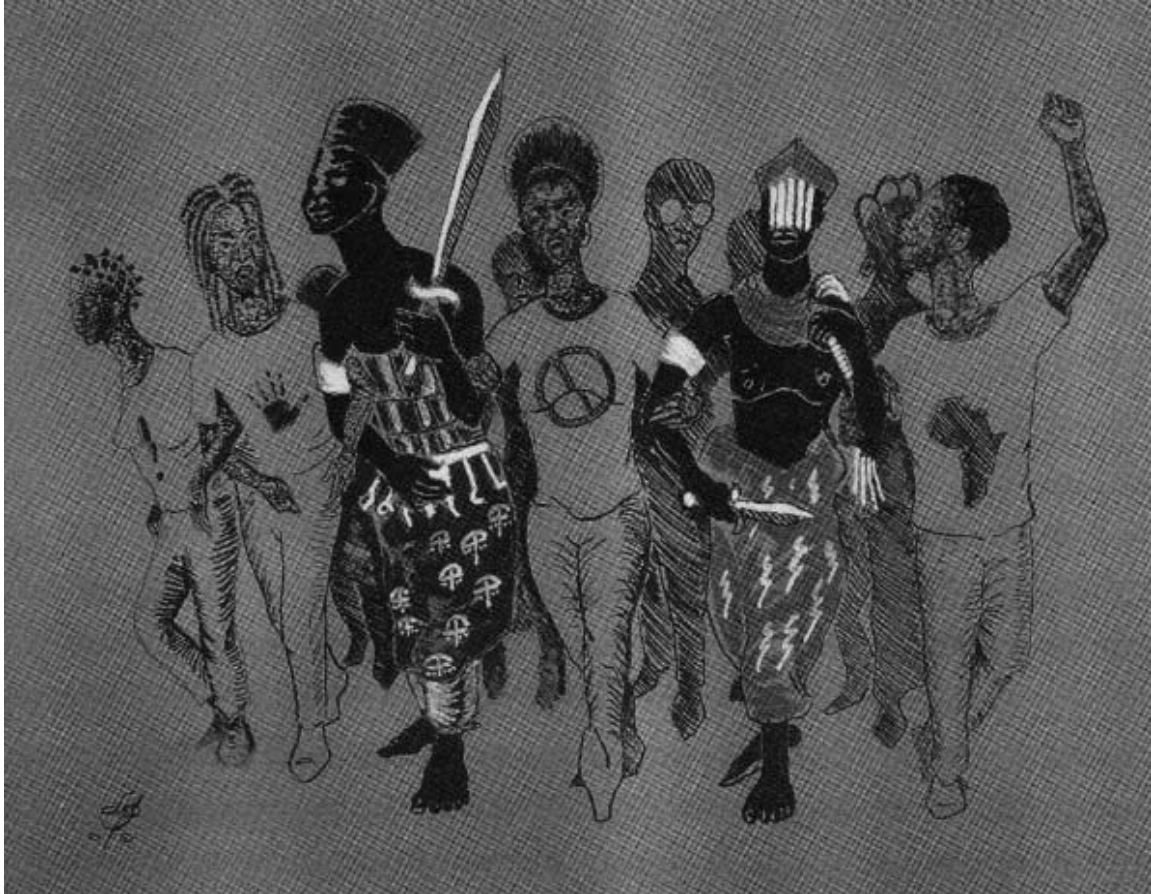
Figura 12 - Linha de frente (Iansã e Ogum)