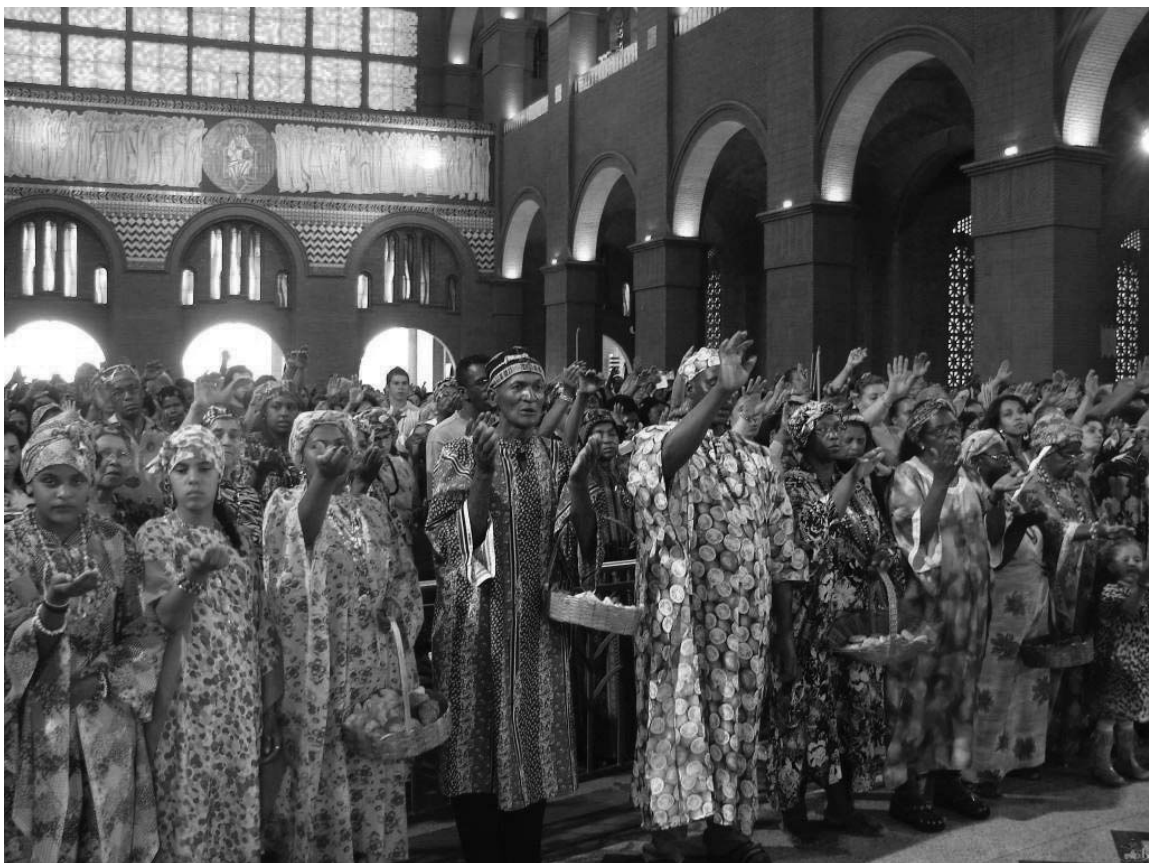
Figura 7 - Missa inculturada no encontro de comunidades negras na Basílica de Nossa Senhora Aparecida