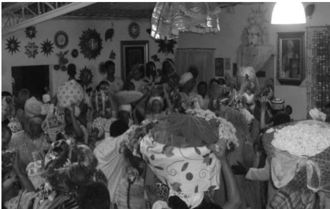
Figura 4 - Oferenda das comidas dos orixás em um terreiro de candomblé em São Paulo.