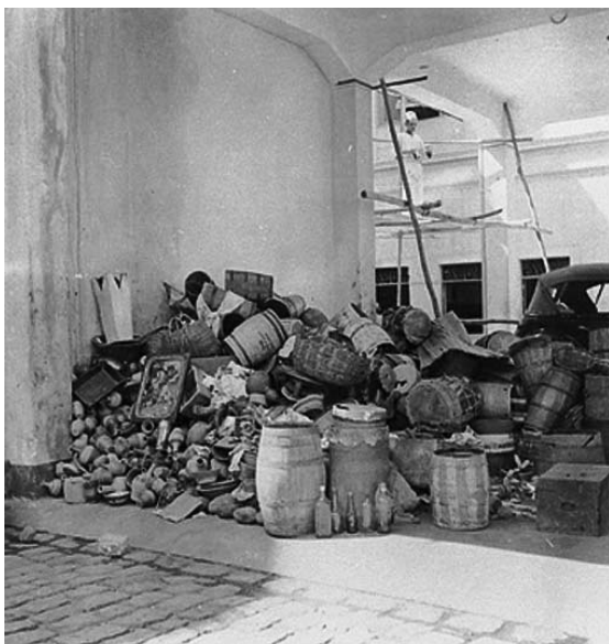
[Figura 2 C]

Figuras 2 A, B, C - Instrumentos e assentamentos religiosos em uma delegacia de polícia, Recife, Pernambuco.