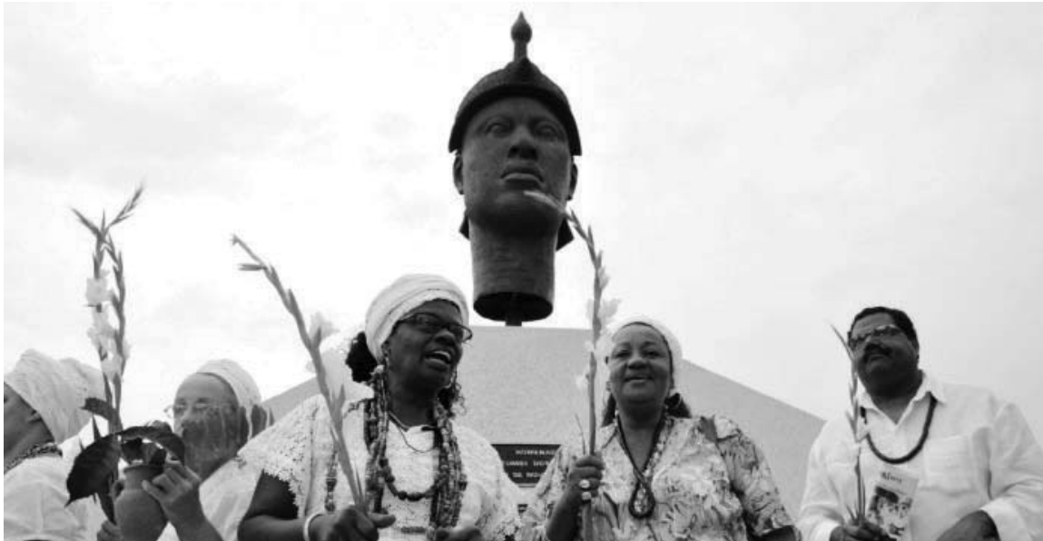
Figura 8 - Adeptos das religiões afro-brasileiras celebrando o Dia da Consciência Negra (20/10/2012), com a lavagem da imagem de Zumbi dos Palmares no Rio de Janeiro.