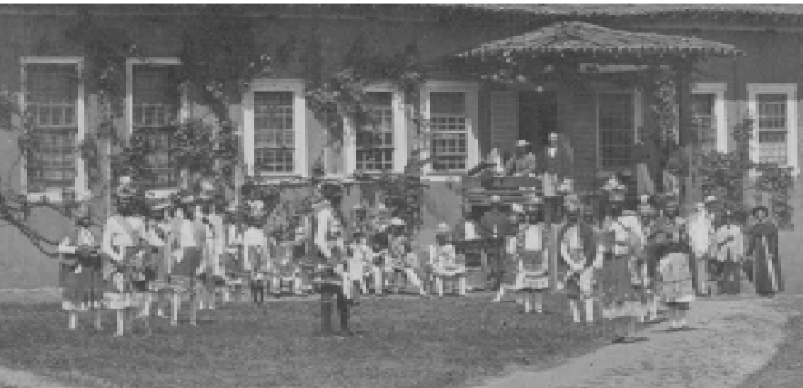
Figura 3: Congada em 1868.