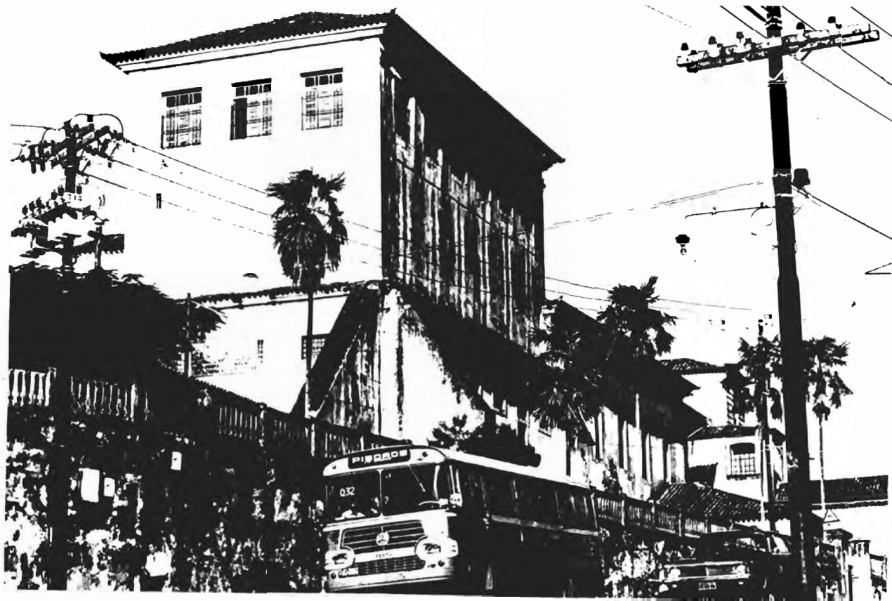
Mirante do Destêrro, feito entre 1683-1685, para aumentar a igreja já existente desde o começo do séc. XVII.