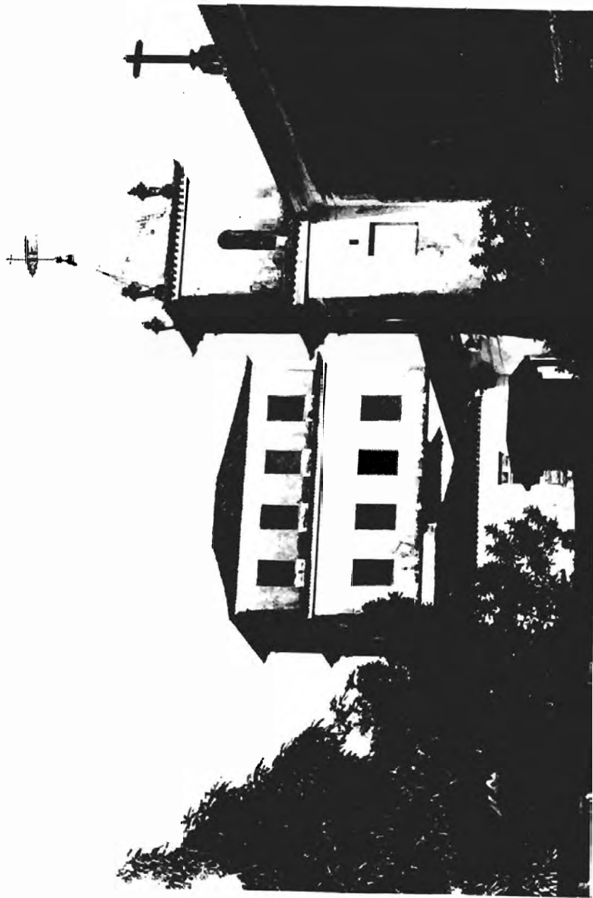
Mirante do Convento da Lapa, juntamente com a torre da primeira igreja da mesma invocação, já existente em 1725.