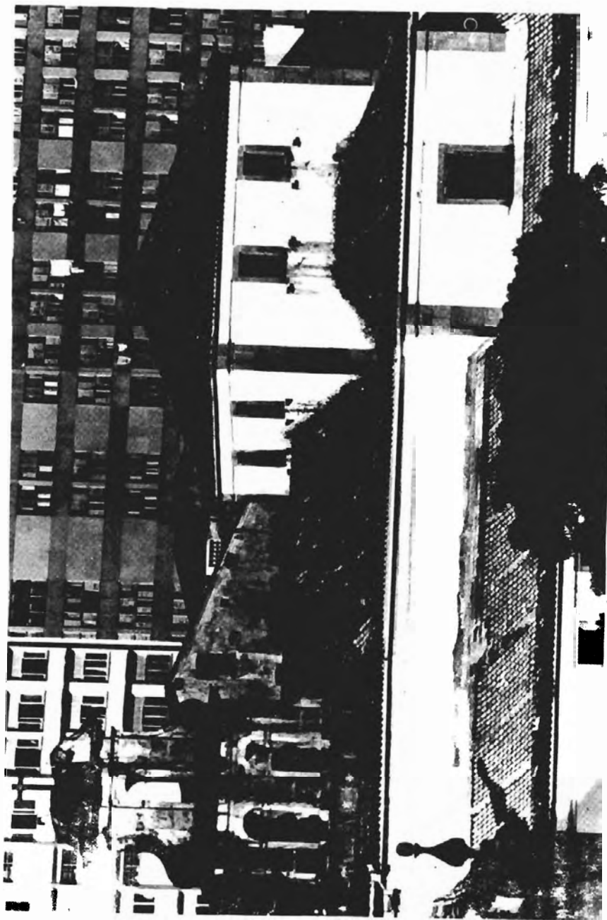
Mirante da igreja de Sta. Tereza, construído por volta de 1690; encobre a cúpula, quase igual à de São Bento.