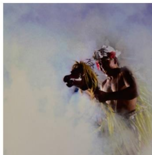
Putu Angga Pratama Warsana Trance Foto Di Atas Syntetic 70 x 70 cm 2016