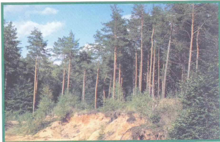
3. kép Mészkerülő erdeifenyvesek ( Genisto nervatae-Pinetum ) kavicstakarón kialakult állománya Kétvölgy határában