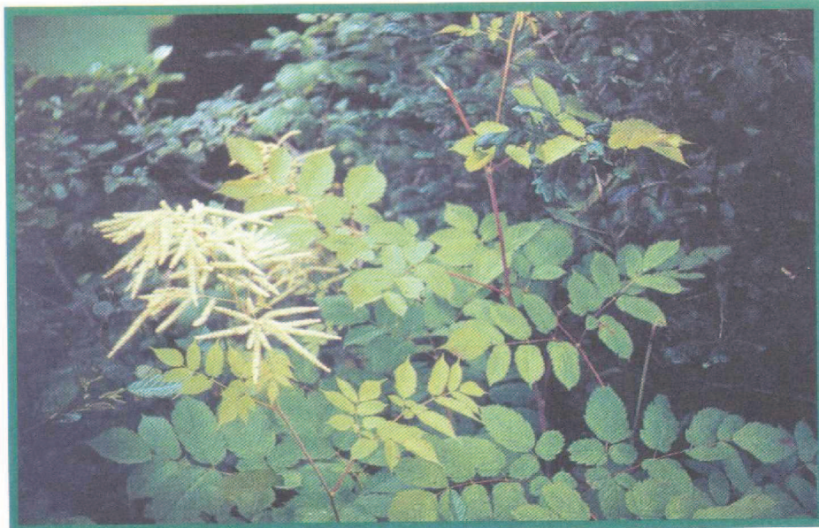
4. kép Tündérfürt-populáció ( Aruncus dioicus ) völgyalji kükösök szegélyén Rátótfalunál