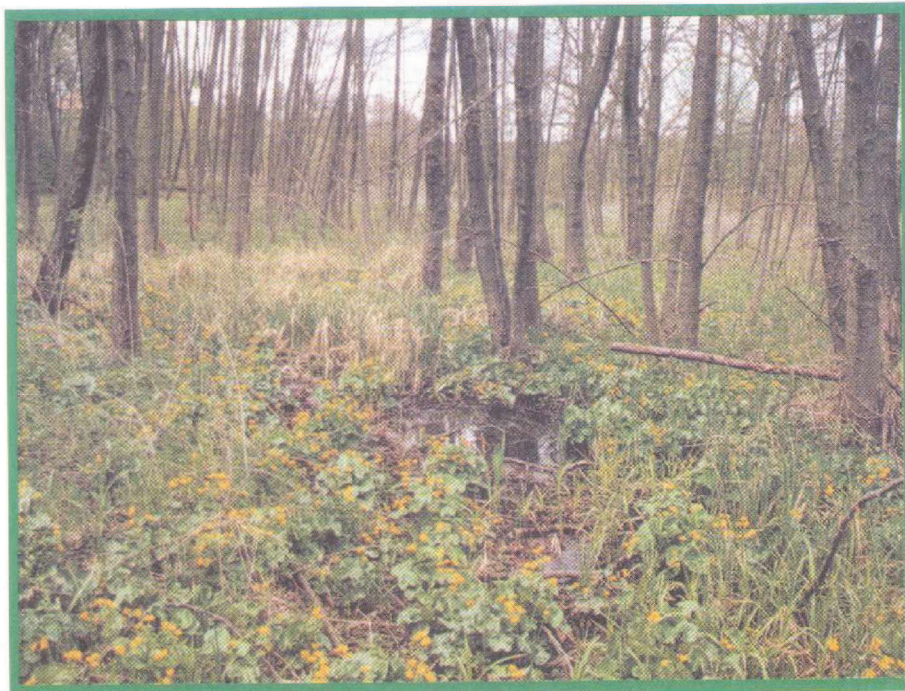
2. kép Dombvidéki égerliget-állomány ( Aegopodio-Alnetum ) a Zala-völgyében Nagyrákosnál