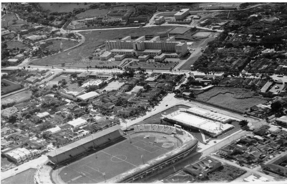
Imagen 2. Estadio Galilea. I Juegos Olímpicos Nacionales 1928.

El arreglo del ESTADIUM DE GALILEA es algo sorprendente y en esa obra tiene todo su empeño en nuestro progresista gobernador, quien ha hecho todo cuanto ha estado de su parte con la mira de hacer de ese sitio algo no solamente cómodo y adaptado para el fin que se busca, sino también espléndido. Y debe reconocerse que el éxito ha coronado todo el cúmulo de esfuerzo que le ha consagrado. Día y noche ha trabajado con solícito empeño el doctor Holguín Lloreda por hacer que el departamento, y especialmente la capital, sepan responder a la distinción de que fueron objeto por parte del Ejecutivo Nacional. Al señalar este departamento para que se efectuarán en el las Olimpiadas del presente año, de suerte que ha estado, como siempre, a la altura de su deber y por su parte ha llenado la obligación que le correspondía de una manera plenamente satisfactoria 167