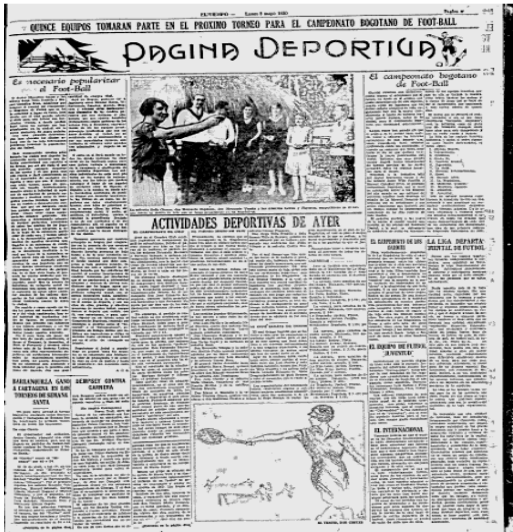
Imagen 1. Página deportiva periódico “El Tiempo”. 5 de mayo de 1930.

Es de resaltar, como la prensa y el deporte se complementan en el proceso de expansión y fomentación de ambos en el país, pues, teniendo en cuenta, que la prensa y el deporte tuvieron un progreso semejante y paralelo dentro de la sociedad colombiana, se van a convertir en grandes aliados para la propagación y consolidación de ambos en el país