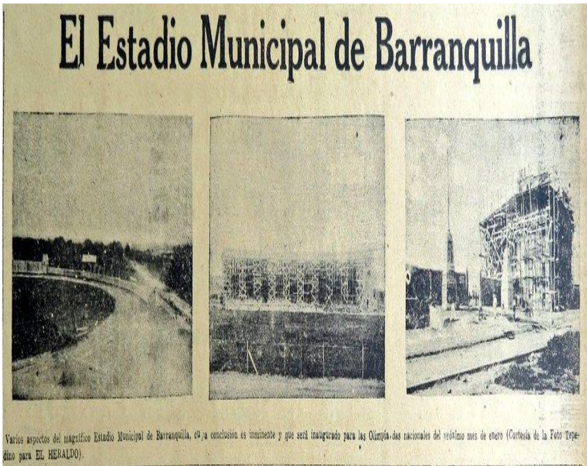
Imagen 4. Estadio Municipal de Barranquilla.

Según la prensa, la construcción del estadio para el evento tuvo un impacto no solo en materia de percepción del desarrollo sino además fue motivo de solidaridades sociales en torno a su ejecución. Por otro lado, sería propicio tener en cuenta los referentes simbólicos e ideológicos internacionales que influenciaban la necesidad de construir escenarios como estos, los estadios construidos durante gran parte del siglo XX no se concebían en absoluto según criterios de seguridad para los espectadores, sino principalmente como demostración del poderío de un Estado, de una ciudad o, incluso, de un club 176