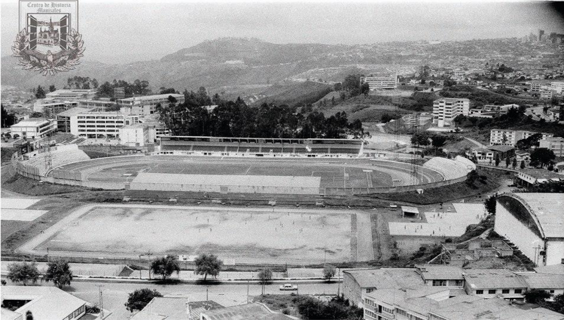
Imagen 5. Estadio Fernando Londoño.

Bucaramanga para la V edición de los Juegos, puso su mayor esfuerzo en la construcción del estadio Alfonso López Pumarejo, esfuerzo que les proporcionara tener el aval para la organización del evento