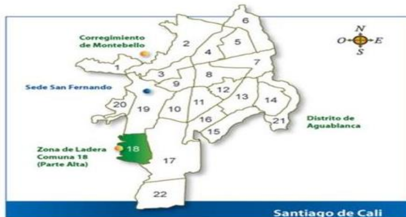
Figura 1. Mapa de Santiago de Cali con la ubicación de la comuna 18