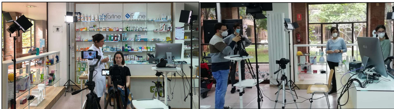
Figura 1: Imágenes de la grabación de los vídeos para los contenidos del SPOC,