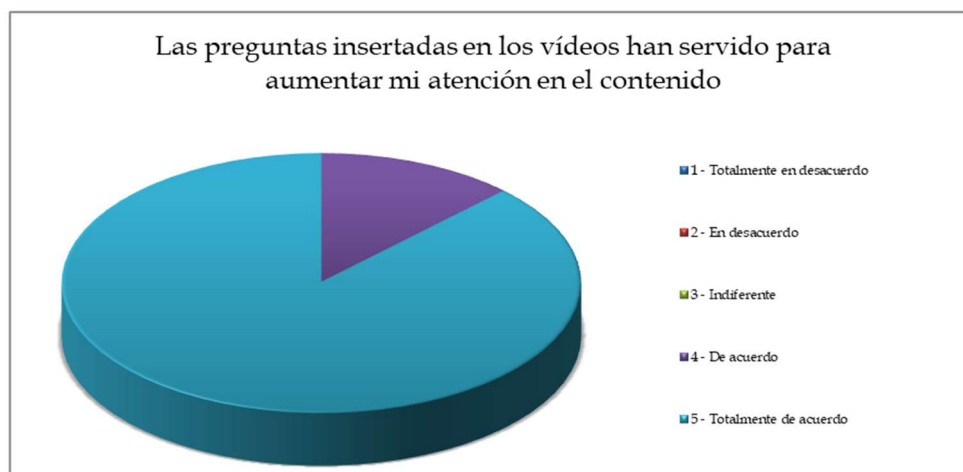
Figura 5: Respuestas de los alumnos acerca de la utilidad de las preguntas insertadas.

También los resultados de esta encuesta nos permiten confirmar cuantitativamente la satisfacción el uso de preguntas insertadas en los vídeos por parte de los participantes, que estuvieron en un 87.50 % totalmente de acuerdo en su utilidad como herramienta para mantener la atención a los videos, como se ve en la Figura 5.