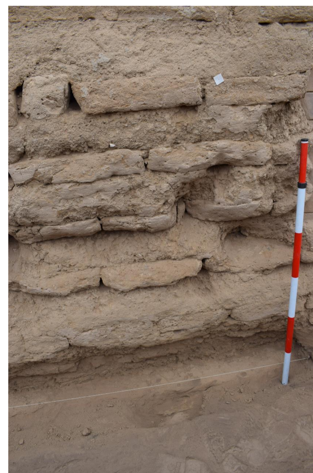
Detalle de un muro de adobes planos, nótese la mampostería consistente de una gruesa argamasa entre hiladas de adobe