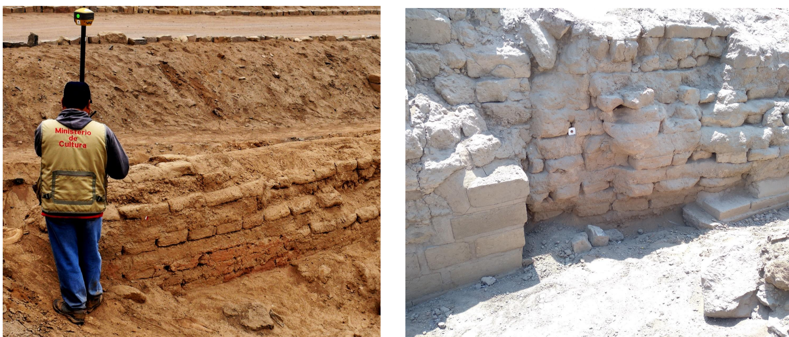
Muro de adobes planos ubicado en la extensión del Pasadizo este, cerca a la Sala central. Nótese a la derecha el muro tardío, cortando y adosándose al muro de adobes planos.