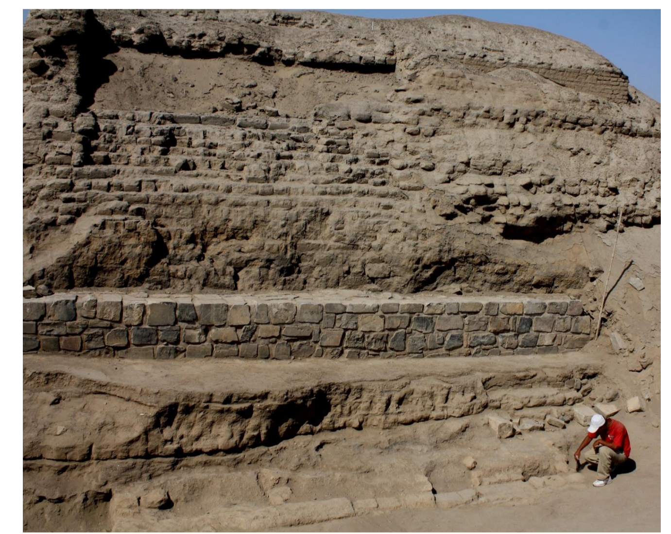
Muro de adobes planos debajo de la continuación de la Calle norte-sur, al pie de la PCR 12

Recientemente el equipo del Museo Pachacamac identificó, al pie de la Pirámide con Rampa (PCR)12, una serie de pequeños recintos rectangulares construidos con este tipo de adobe. Debajo del pasadizo oeste, colindante a la PCR 13, se identificaron dos recintos rectangulares. En la Sala Central el muro sur, que corresponde a la Primera Muralla, está conformado con este tipo de adobe; en el pasadizo este, Jorge Aching identificó un largo muro de época tardía que corta y se adosa a un muro de adobes planos, que corre paralelo a la Primera Muralla.