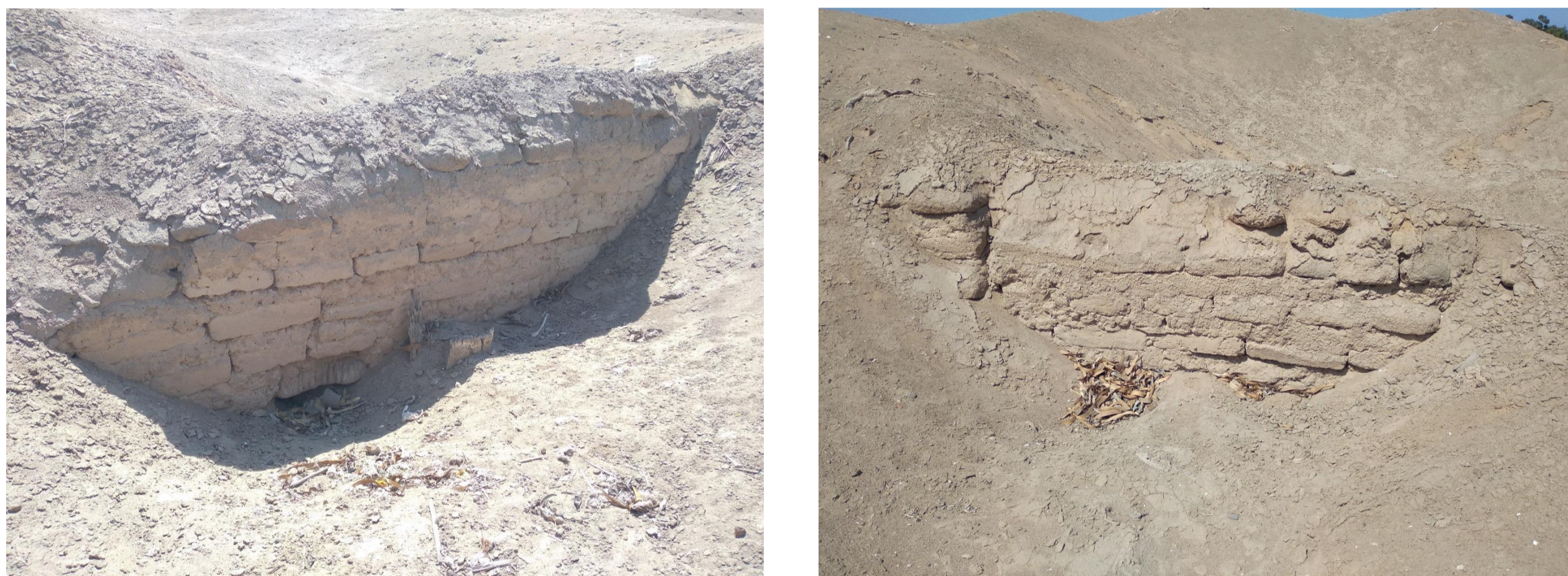
Muro de adobes planos ubicado cerca al edificio de Urpiwachaq.

El primer reporte proviene del Templo Viejo, donde se identifica este tipo de adobe en la fase del Templo policromo (Franco y Paredes: 2003). Posteriormente, Luisa Díaz lo registra en un muro cerca al templo de Urpiwachaq (Díaz, 2004). Shimada lo registra como parte de los contextos ubicados debajo de la Plaza de los Peregrinos, asignándolos a fines del Horizonte Medio e inicios del Intermedio Tardío (Shimada et. al., 2010). Rommel Ángeles y Denise Pozzi-Escot (2011) identifican este tipo de adobe en el edificio B15, en una plataforma aledaña al templo de Urpiwachaq, así como en algunos sectores de la plataforma superior del Templo Viejo, asignándolos a fines del Horizonte Medio. En el Cuadrángulo Tello, Krzysztof Makowski halló arquitectura de adobes planos asociada a pisos y a basura doméstica con cerámica Wari, Huamanga e Ychma Temprano (Makowski et al, 2021).