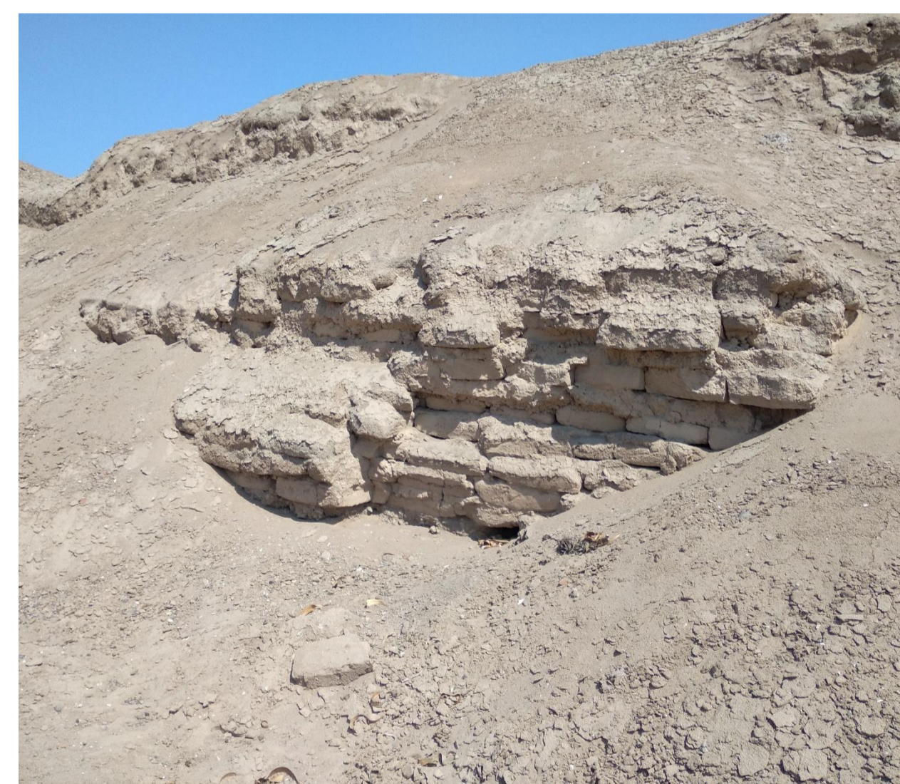
Muro de adobes planos ubicado al oeste del Santuario