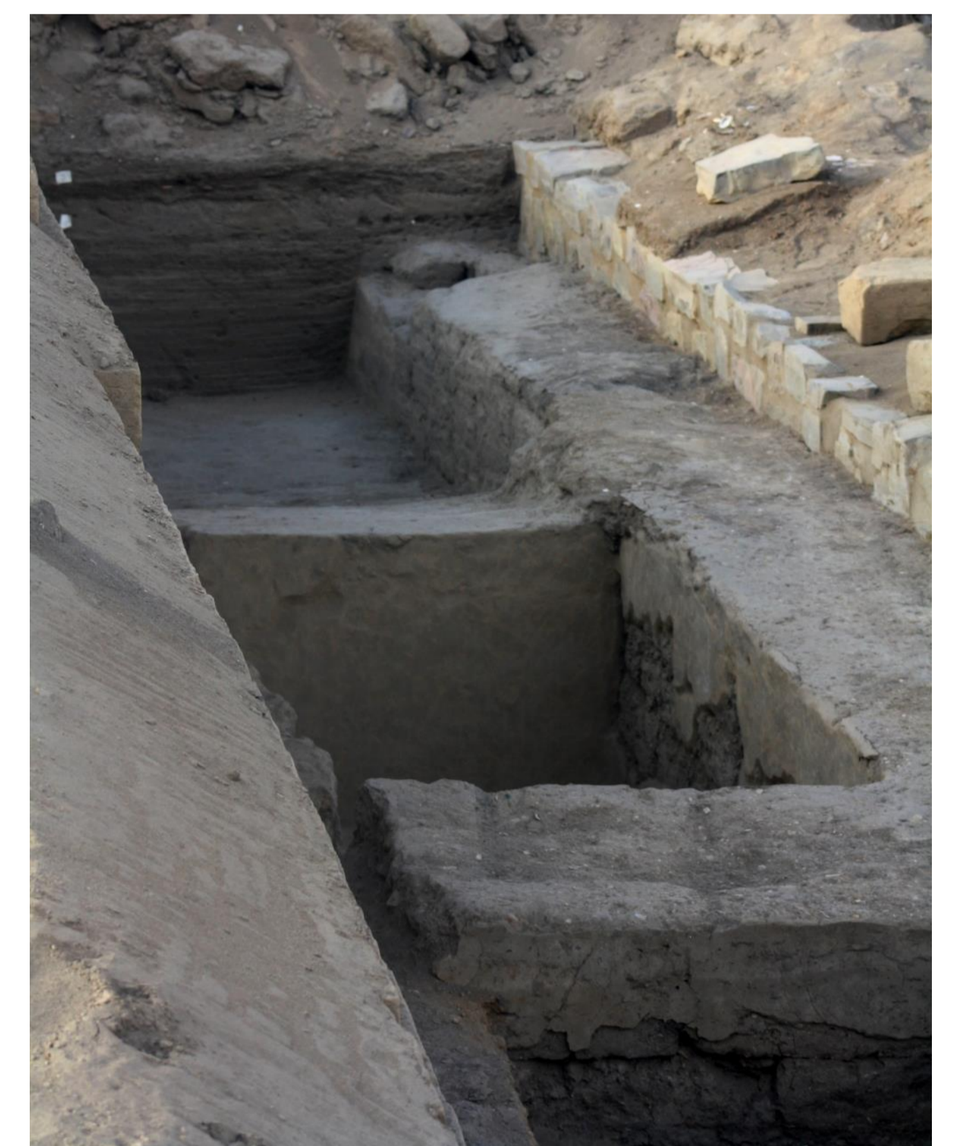
Muros de adobes planos hallados por debajo de un pasadizo al oeste de la PCR13