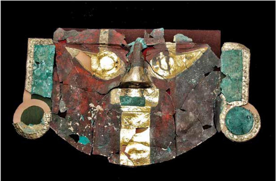
Mascara Funeraria de la Cultura SICAN