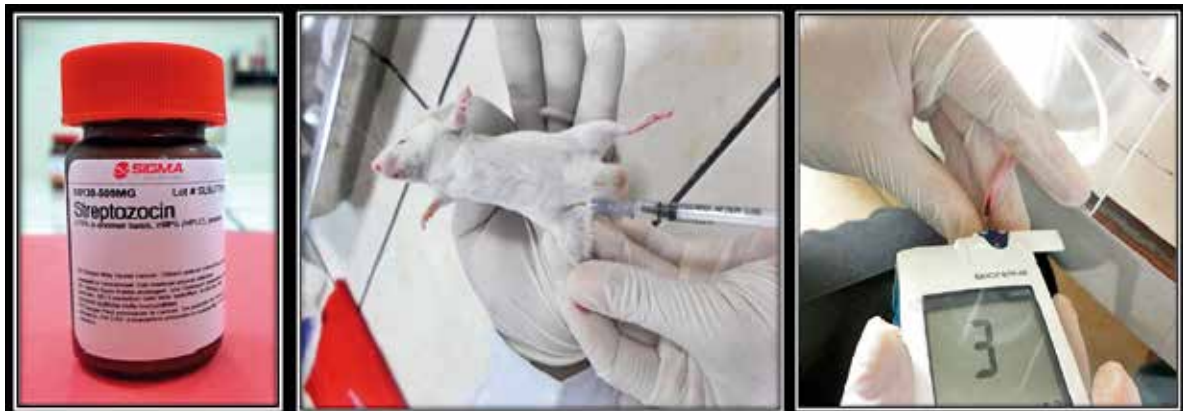
Figura 1. Agente diabotogénico, 2. Inducción de hiperglicemia por vía intraperitoneal a ratones Mus musculus cepa Balb/c, 3. Medición por vía intracaudal utilizando glucómetro digital marca Bionime GM300.

Para observar los efectos del Cuti – cuti sobre la glicemia normal, ambos grupos de 10 ratones cada uno recibieron 60 y 70 mg/Kg de estreptozotocina, vía intraperitoneal, para inducir hiperglicemia experimental. Posteriormente, el grupo I recibió suero fisiológico y el grupo II, Cuti – cuti a la dosis de 1 mL durante una semana de tratamiento; controlándose la glicemia a los 0, 60, 120, 180 y 240 minutos y al primer, cuarto y séptimo día de tratamiento respectivamente. Los resultados fueron leídos con tiras reactivas del glucómetro digital marca Bionime GM300.