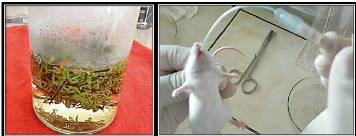
Figura 4. Infuso de Pellaea ternifolia a 200 mg/Kg, 5. Inoculación por vía orogástrica del infuso de "cuti – cuti" a ratones Mus musculus cepa Balb/c.