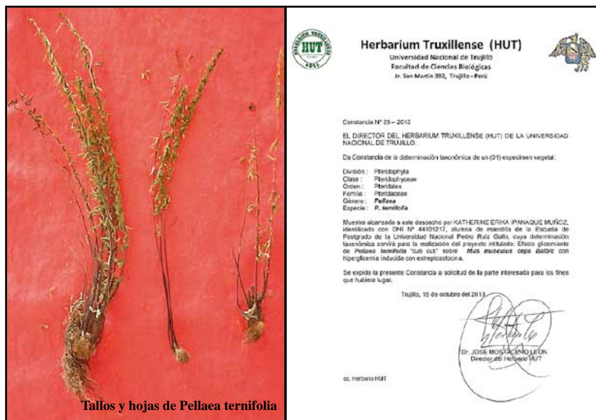
Tallos y hojas de Pellaea ternifolia