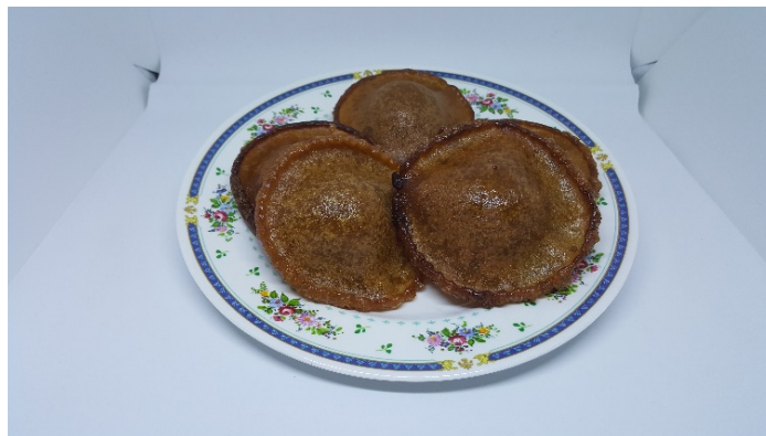
Gambar 1. Penganan Iban

Kepercayaan Mali tersebut dapat dilihat dalam beberapa tindakan masyarakat Iban semasa menghasilkan penganan. Menurut Siah Batang (64 tahun) proses membuat penganan adalah dengan merendam beras baru semalam agar senang ditumbuk menjadi serbuk beras sebagai acuan utama penganan. Oleh itu, lesung yang digunakan untuk menumbuk serbuk beras tidak boleh dilangkah sebarang oleh masyarakat Iban kerana akan mengakibatkan mali yang membawa seseorang tersebut terkena tara. Selain itu, sekiranya lesung diinjak menggunakan kedua-dua kaki dipercayai akan menyebabkan masyarakat Iban tersebut enda ampit dan selalu ketinggalan dalam semua perkara yang baik dan menguntungkan. Walaubagaimana pun, dalam proses membuat Penganan perkara ini adalah tidak dilarang dan menjadi satu kewajiban agar beras tersebut mudah untuk menjadi serbuk dan digunakan sebagai bahan utama untuk memproses Penganan.