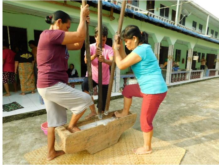
Gambar 2. Wanita Iban Menumbuk Beras Dalam Lesung

Dalam proses memasak Penganan terdapat beberapa pantang larang yang harus dititikberatkan, kualiti yang hendak digunakan haruslah disapu dengan daun sireh terlebih dahulu. Tujuannya adalah sebagai petua untuk mengelakan jelungan semasa proses mengoreng penganan. Penggunaan daun sireh adalah sangat signifikan dalam amalan, ritual dan perubatan tradisional Iban, selain dijadikan sebagai sumber makanan sampingan atau kudapan di masa senggang oleh para wanita Iban terdahulu. Selalunya, seminggu sebelum Gawai wanita-wanita Iban akan mempersiapkan diri untuk proses membuat penganan bagi menyambut Pesta Gawai sebagai tanda kesyukuran atas hasil tuaian padi yang diperolehi tahun itu. Mereka akan mengadakan aum indu (mesyuarat wanita) bagi menentukan Tarikh membuat kerja-kerja persediaan dalam menyambut Gawai termasuklah membuat Penganan. Etika ini adalah sebagai simbol tolenrasi yang tinggi diamalkan oleh masyarakat Iban di rumah panjang. Mereka saling tolong-menolong dan melakukan sesuatu perkara tersebut sebagai satu komuniti.