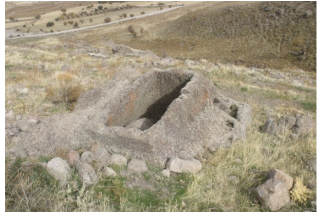
Resim 4: Yukarı Ören, oyuğu tekne mezar.