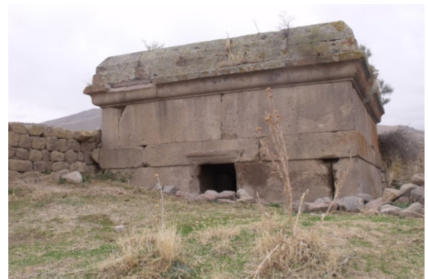
Resim 1: Madenşehir, anıt mezar (Mausoleum).

Binbir Kilise'de sadece bir yapıyla temsil edilmektedir 6 . Köylüler tarafından "Darphane" olarak adlandırılan anıt mezar, Madenşehir Köyü'nün içerisinde, Uzunkuyu Köyü'ne giden yolun batısında yer almaktadır. Büyük ölçülerde bir sıra ince ve bir sıra kalın olmak üzere düzgün kesme taşlarla örülmüş bir podyum üzerinde yükselmektedir. 2.80x3.35 m ölçülerindeki mezar odasının girişi doğu yönünden dikey dikdörtgen bir açıklıkla sağlanmaktadır. Podyumdan sonra bir sıra profilli çıkıntı yer almakta ve buradan üst bölüme geçilmektedir. Burada yukarıya doğru daraldığı anlaşılan üst yapının ilk sırasının korunduğu gözlenmektedir.