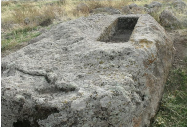
Resim 2: Yukarı Ören, Kaya ostateki

Yukarı Ören'in Üçkuyu yoluna bakan kuzeybatı yönünde küçük bir dere vasıtasıyla bölünmüş yamacın doğu yakasında bir mezar yapısı yer almaktadır. Eser, 1.15x0.34x0.19 m olan ölçüleri nedeniyle muhtemelen kremation tarzı gömüyle ilişkilendirilebilecek bir kaya ostotekidir. Ancak çevresinde bununla bağlantılı herhangi bir kaya döşemine rastlanmamaktadır. Bu nedenle sunu çukuru gibi dinsel ve törensel bir işleve sahip olmamalıdır. Binbir Kilise mezar yapıları içerisinde başka bir örneğine rastlanmayan ostotekin yakınında üstünü örtecek bir kapağa da rastlanmamaktadır.