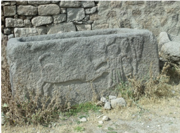
Resim 9: Madenşehir, lahit gövdesi.

Binbir Kilise mezar yapıları içerisinde taşınabilir lahitlere Madenşehir'de rastlanmakta olup bu lahitlerden bir kısmının dış yüzeyleri kabartma figürlerle süslenmiştir. Bunlardan bir tanesi, köy camisinden batıya doğru giden yolun sağında yer almaktadır. Bu lahit gövdesi, 1.98x1.00x0.85 m ölçülerindedir. 1.64x0.73x0.60 m'lik alana bir takım figürler işlenmiştir. Lahit gövdesinin ön yüzünde hareket halinde bir aslan, her iki elinde seçilemeyen bir takım objeler tutan bir kadınla muhtemelen selvi ağacından oluşmuş bir kompozisyon yer almaktadır. Bu kompozisyondaki selvi olması muhtemel ağaç Antik dönemde ölü kültürüyle ilgilidir. Aslan ise, ölüyü ve mezarı kötülüklerden koruyan bir işleve sahiptir. Lahitin iki yan ve bir düz yüzünde herhangi bir süslemeye rastlanmamaktadır.