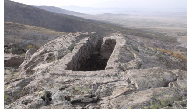
Resim 7: Değle, oygu tekne mezar

Yine Yukarıkaya Asar tepesinde yan yana açılmış iki oygu tekne mezarın bulunduğu kayalığın ucunda, batısındaki ovaya hâkim konumda bir oygu tekne mezar daha yer almaktadır. 1.73x0.55x0.47 m ölçülerindeki mezar da yerel siyah taştan yapılmıştır. Bu mezarlardan birisine ait olması gereken üçgen formundaki bir kapak, ana kayanın hemen güneyinde yer almaktadır. Kapak, çevredeki benzerleri gibi kabaca işlenmiş köşe akroterlerine sahiptir.