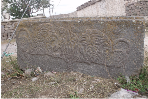
Resim 10: Madenşehir, lahit gövdesi.

Öte yandan Madenşehir Köyü nekropol sahası içerisinde bazıları değişik motiflerle süslü, bazıları sade bırakılmış, bazıları ise büyük ölçüde toprağa gömülü olduğu için işlemeleri konusunda bir fikir sahibi olunamayan çok sayıda lahit gövdesi yer almaktadır. Aynı şekilde köy merkezinden başlamak üzere Uzunkuyu Köyü yolu üzerinde yerel siyah taştan yapılmış, üçgen alınlıklı, alınlığın ortasında rozet benzeri süslemelerin yer aldığı, köşelerde ise kabaca işlenmiş aktoterlerin bulunduğu birçok lahit kapağı da bulunmaktadır.