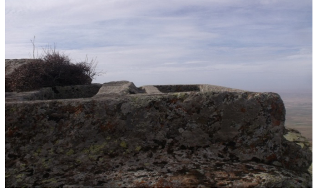
Resim 6: Değle, yan yana açılmış iki oygu tekne mezar.