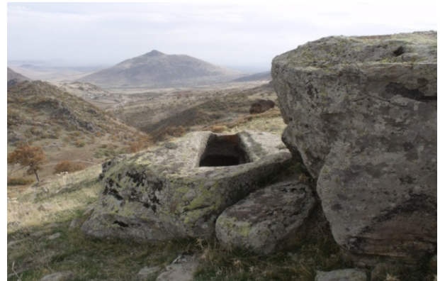
Resim 8: Değle, oygu tekne mezar.

Değle yerleşiminin doğu ucundaki küçük tepecikte yer alan oygu tekne mezar ise, Kızıldağ'a nazır konumuyla dikkat çekicidir. 33 ve 36 nolu yapı grubunun doğusunda yer alan mezar, 2.00x0.76x0.40 m ölçülerindedir. Söz konusu mezar da buradaki benzerleriyle aynı özellikleri taşımaktadır.