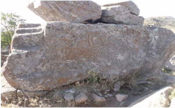
Resim 5: Değle, oygu tekne mezar.

Mezarın üzerinde iki parça halinde yer alan 9 üçgen alınlıklı kapağının ortasında rozet benzeri bir süsleme bulunmaktadır. Ayrıca kabartmanın sol tarafında muhtemelen sunak masası olarak kullanılmış düzlük üzerinde büyükçe ve düzgün oyulmuş bir çukur yer alır. Aynı şekilde kabartmanın kuzeyinde ve güneyinde yer alan üzeri düzlenmiş küçük kaya kütleleri üzerinde de biraz daha küçük boyutlu iki çukur daha bulunmaktadır. Sözü edilen çukurlar, kaya mezarları veya ölü gömme ayinleriyle ilişkilendirilmekte, yapılan törenlerde içlerine bir sıvı madde ve muhtemelen de içki konulduğu düşünülmektedir. Bu yönüyle de Geç Hitit Devri kaya anıtları ile ilişkilendirilmektedir (Temizsoy, 1983: 2).