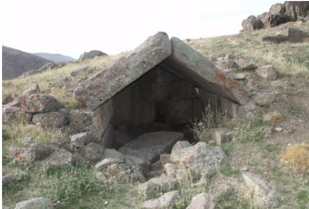
Resim 3: Değle, Yer altı Örgü Mezar

Buradaki yer altı örgü mezarlardan zamanımıza nispeten sağlam olarak gelebilen bir tanesi, dikdörtgen şeklinde olup düzgün kesme taşlardan yapılmıştır.