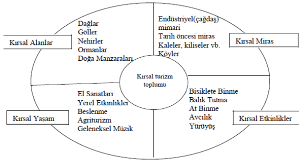
Şekil 2. Kırsal turizmin bileşenleri (Halloway and Taylor 2006)

agro-turizm ise çoğunlukla kırsal alanda ana faaliyet dalının tarım olması nedeni ile bir çeşit kırsal turizm faaliyeti olarak tanımlanmaktadır. Çiftlik turizmi ve agro-turizm genellikle kırsal turizmin küçük bir parçasını temsil etmektedir (Şekil 1)