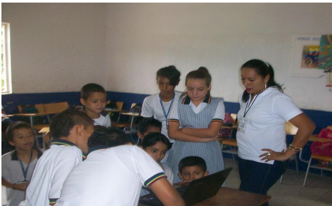
Figura 3. Orientación Clase de Informática