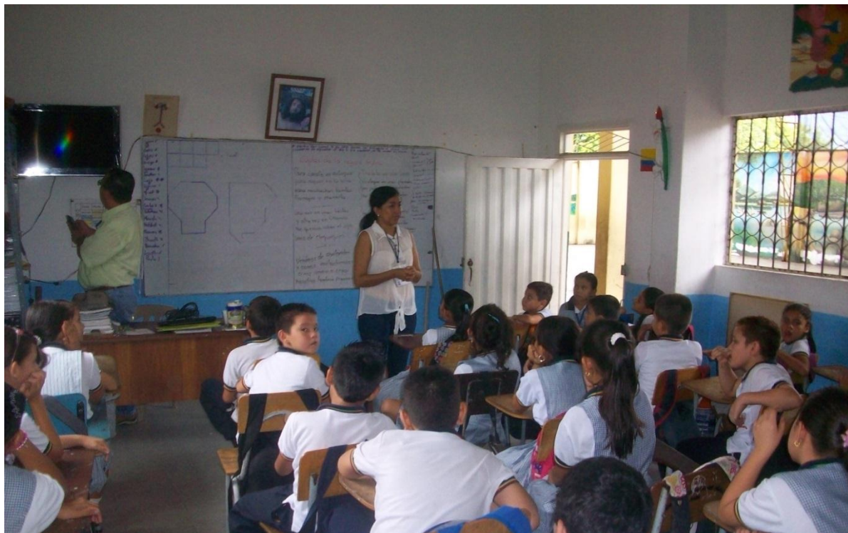
Figura 1. Orientación de Clase Asignatura Lengua Castellana