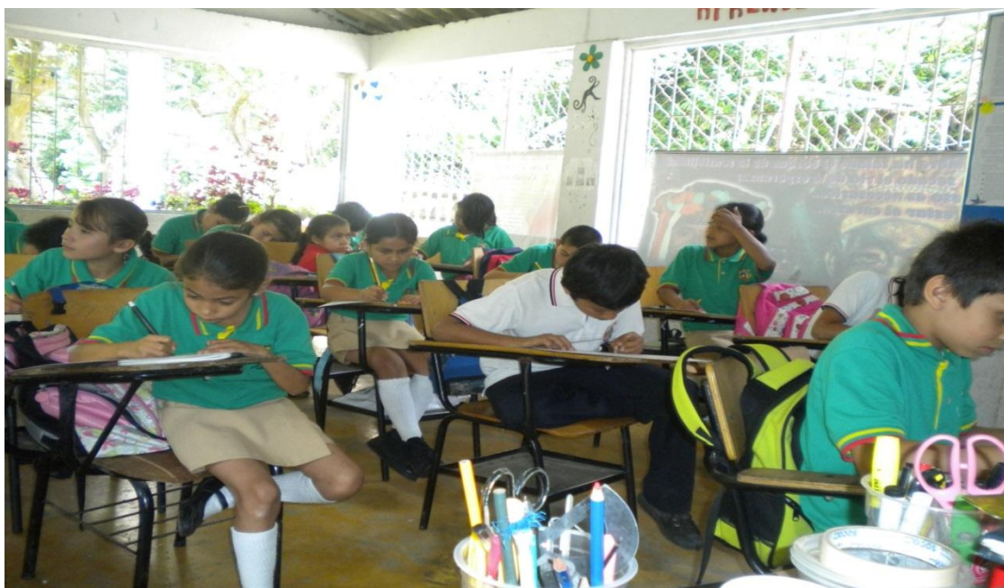
Figura 8. Orientación de Clase Matemáticas

En esta categoría se evidencia la necesidad, por parte de todos los docentes del grado quinto de las Instituciones investigadas, utilizar en la enseñanza, más estrategias pedagógicas lúdicas y activas desde el dominio de estas en que se permita la construcción del saber por parte de los estudiantes (Ver Anexo D).