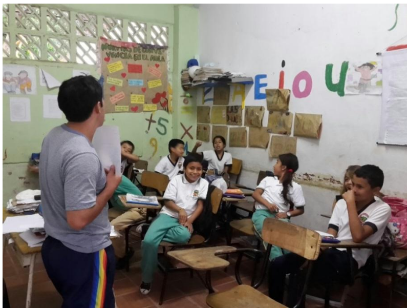
Figura 4. Orientación de Clase Matemáticas