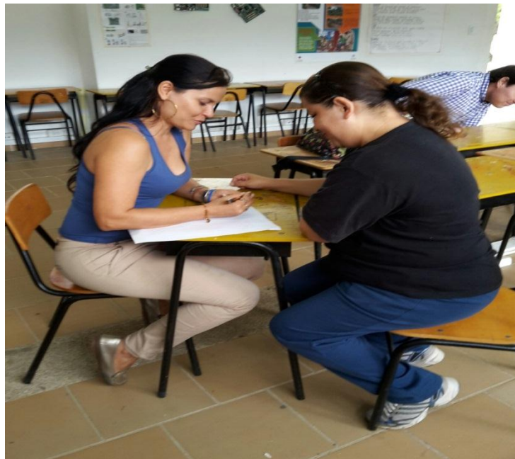
Figura 6. Entrevista a Docente Institución Educativa Técnica Ambiental Combeima

Por tanto es fundamental mejorar e innovar las prácticas pedagógicas para que en las instituciones se fortalezca el conocimiento del modelo pedagógico que plantean en sus proyectos educativos lo cual conlleva a una apropiación del mismo por parte de toda la comunidad educativa (Ver anexo U).