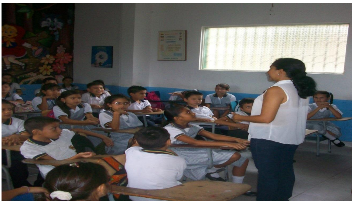
Figura 2. Orientación de Clase Asignatura de Español