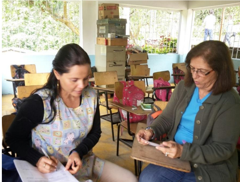
Figura 5. Entrevista a docente Institución Educativa Técnica Ambiental Combeima