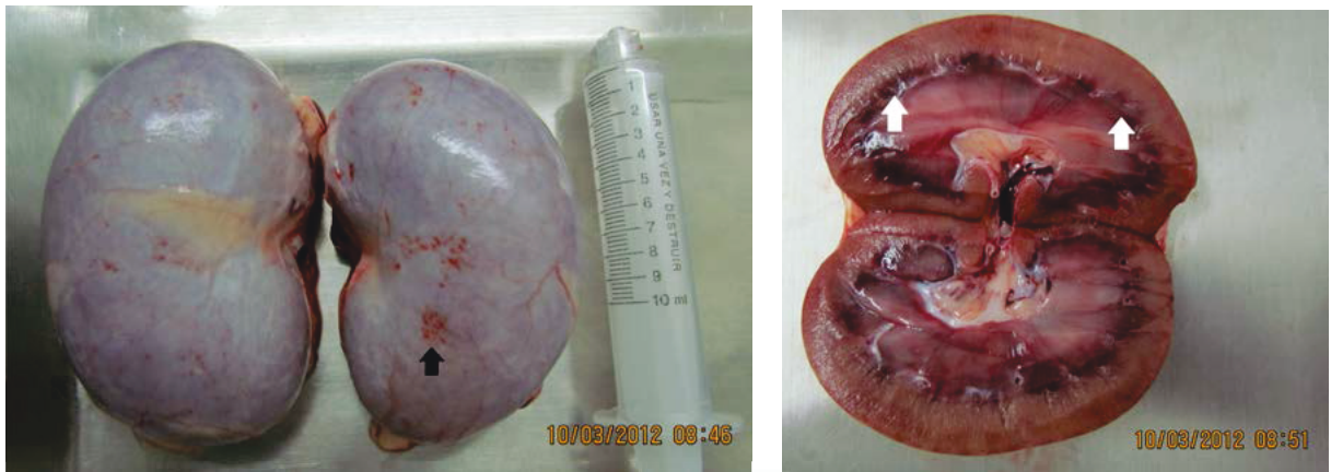
Figura 3. Hallazgos en necropsia. A) petequias en la cápsula renal. B) Unión corticomedular y región medular hemorrágicas.