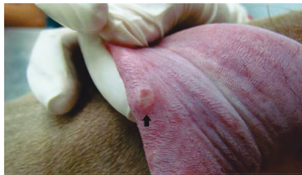
Figura 1A – 1B. Úlceras en mucosa oral y lengua, respectivamente.