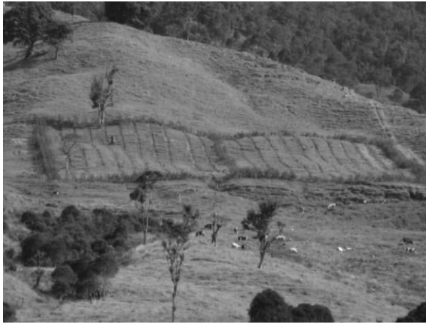
Figura 1. Diseño del sistema silvopastoril

especies sembradas se determinó mediante una cuenta del número total de árboles sembrados de cada especie versus los árboles muertos (figura 1).