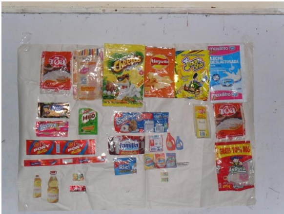
Explicación del collage.