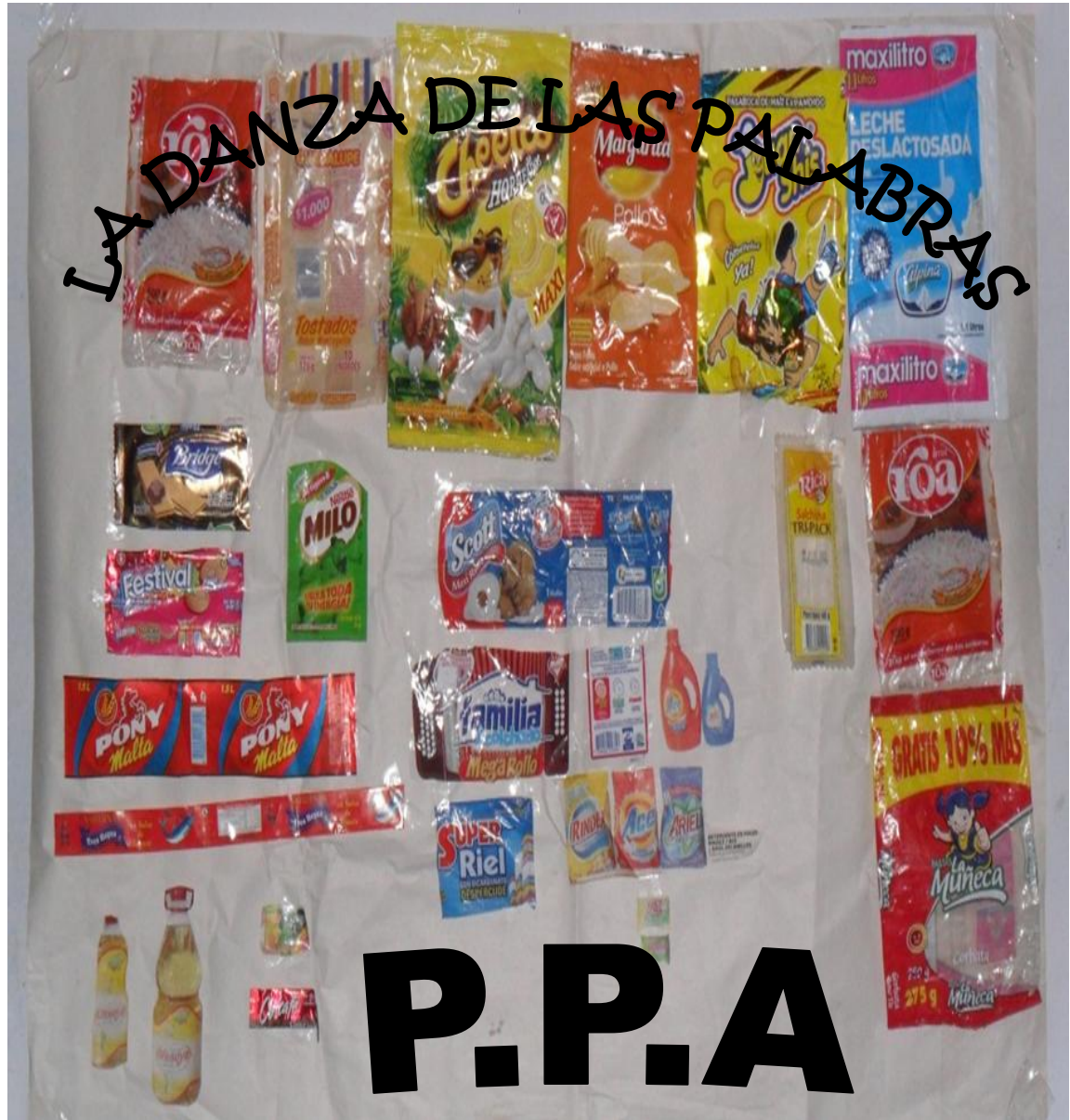
Figura 1. Collage la tienda escolar.