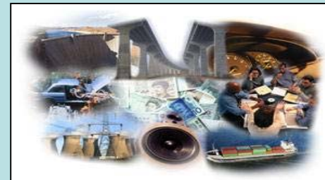
Estímulo à Inovação