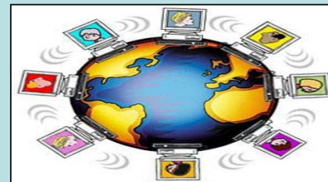
Comunidade de Prat.