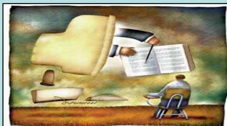
Educação à Distância