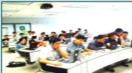
Capacitação em TIC