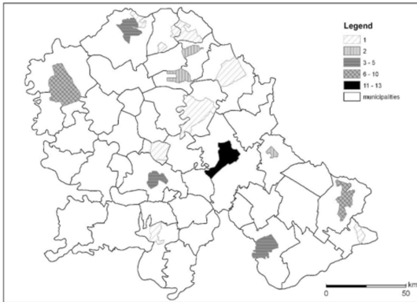
1. ábra: A CARDS-támogatások területi eloszlása a Vajdaságban