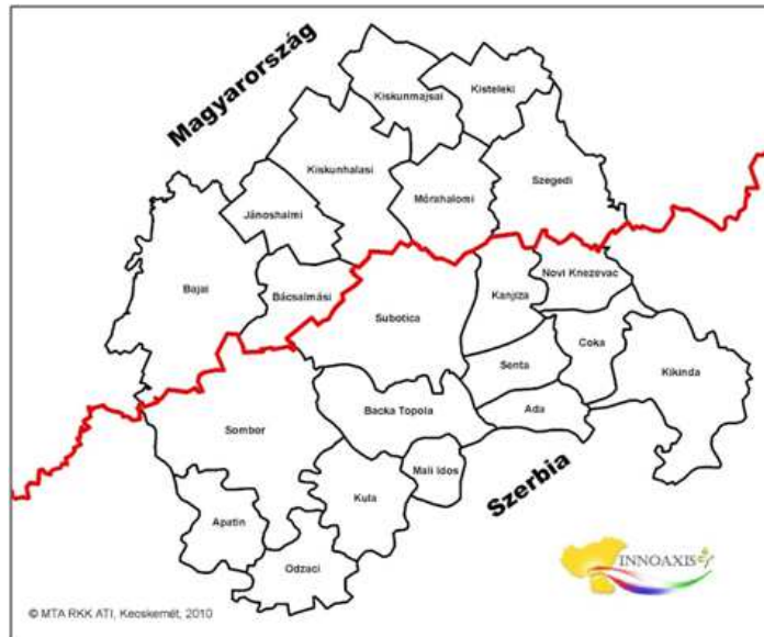
2. ábra: A kutatásban kijelölt határ menti régió és „kvázi kistérségei”