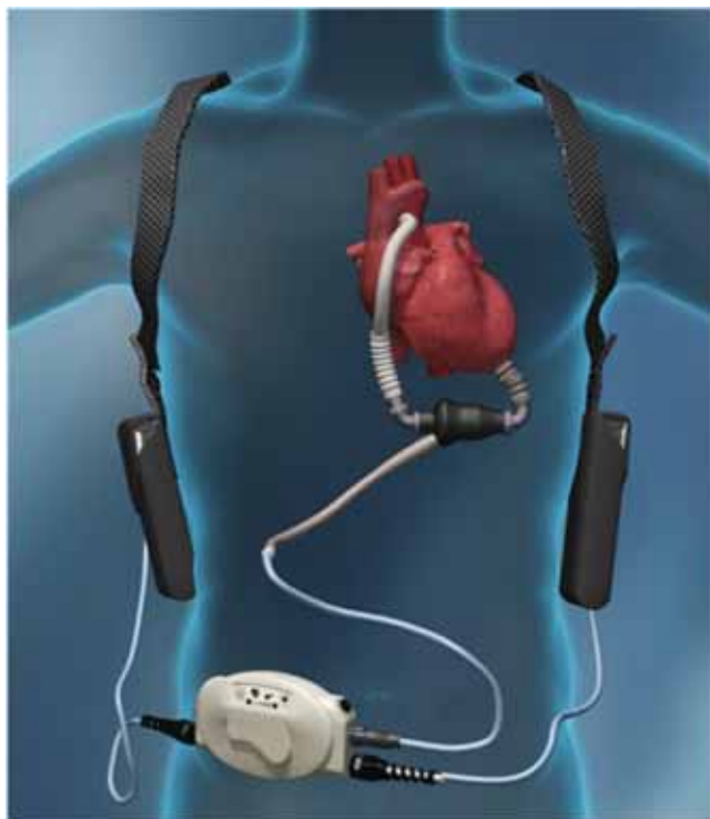
1. ábra | A Thoratec HeartMate II LVAD részei. Az ábrán látható a mellkasban elhelyezkedő pumpa , amelyet a hasfal bőrén kivezetett elektromos kábel köt össze a kontrollér egységgel és a két áramforrással

(Medtronic Inc.) és CardioHelp (MAQUET Cardiopulmonary AG) készülékeket, közepes támogatásra a CentriMag VAD-ot (Thoratec Corp.) használtunk. Ezek a testen kívüli (úgynevezett paracorporalis) eszközök centrifugális pumpafejvel rendelkeznek és flexibilisen adaptálhatók a beteg igényeihez és az aktuális terápiás stratégiához azzal, hogy az oxigenátor a csőszerelékbe kiiktatható, illetve szükség esetén visszaszerelhető, cserélhető.