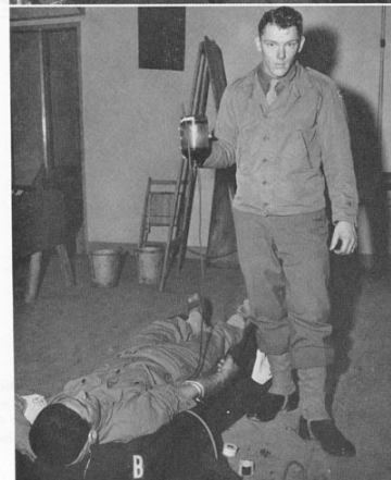
FIGURE 48.—Collection and administration of blood by Ebert-Emerson technique, with improvised equipment. A. Collection. B. Gravity administration.