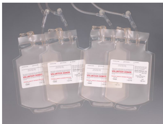
4. ábra: Négyrészes vérvételi zsákrendszer (12.)

Csak a modern eszközök (négyrészes vérvételi zsákrendszer) alkalmazásával vált lehetővé a levett teljes vér komponensekre bontása, így a célzott hemoterápia alkalmazása (4. ábra), a nyolcvanas évektől kezdve. (Oláh, 2012., Vezendi, 2009.)