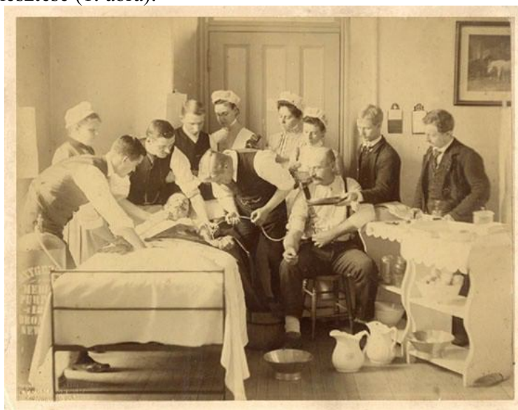
- 1. ábra: Legelső fotó a transfúzió kivitelezéséről: 1870. Bellevue Hospital (O.S. Mason) (10.)

További fejlődést jelentett a transfúzió közvetlenül emberből emberbe történő alkalmazása, a véralvadás elkerülésére. Ezt direkt transfúzióknak nevezték el, ennek során artériából vénába történt a vér átömlesztése (1. ábra).