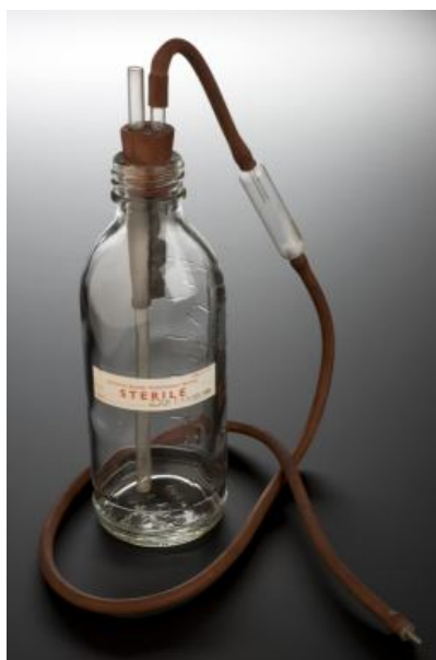
2. ábra: Transzfúziós szerelék az I. világháborúban (14.)

Ennek kivitelezésére speciális szerelék alkalmaztak (2. ábra).